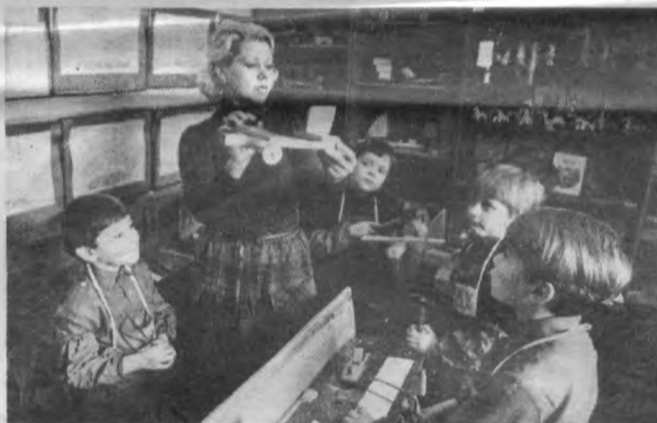
Донецька область «Іграшка» — так називається дитячий садок, який недавно споруджено в новому селищі, де живуть гірники шахтоуправління «Соціалістичний Донбас». За рекомендацією вчених Академії педагогічних наук СРСР для цього дитячого закладу введено годину праці й творчості. Два рази на тиждень кімнати «Іграшки» перетворюються в маленькі цехи та майстерні. Нехитре обладнання придбала для