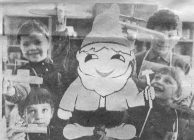
дітей адміністрація шахти. З допомогою дорослих малята прилучаються до корисної праці.