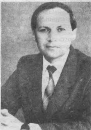
ВУГІЛЛЯ ПІДЕ ПО ТРУБАХ

Новосибірськ. Прокладання вуглепроводу з Кузбасу в Новосибірськ завершив колектив «Новосибірськтрубопроводбуду». По підземній магістралі завдовжки 260 кілометрів з шахти «Инская» вугільна пульпа потрапить у топки спорудженої Новосибірської ТЕЦ-5. Збудовано перший у країні вуглепровід, який дає змогу застосувати ефективний метод транспортування твердого палива. (ТАРС).