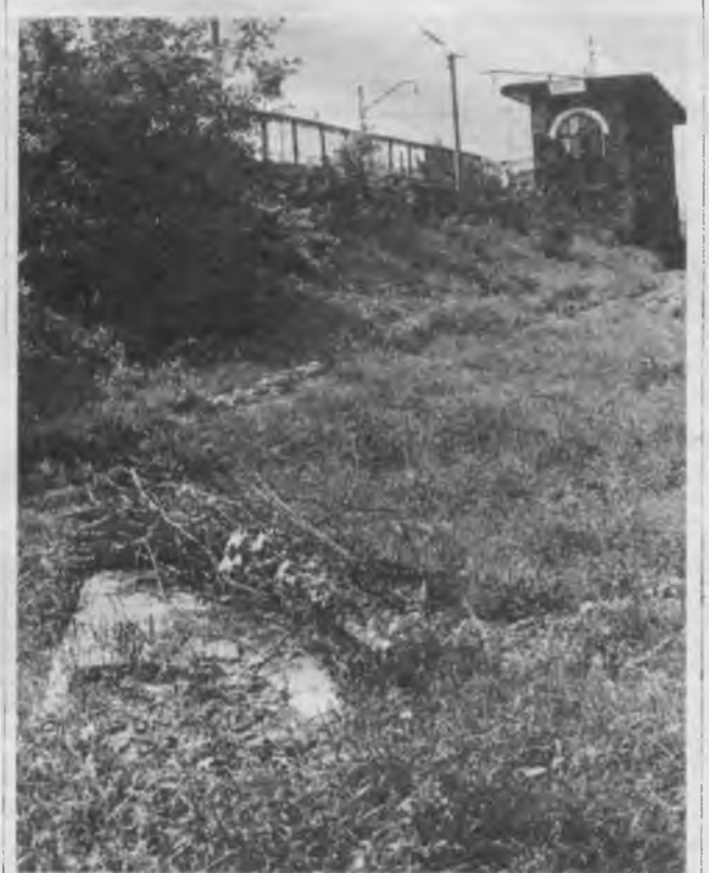
Це фото ми адресуємо управлінню Південно-Західної залізниці. Ремонт платформи, звичайно, вкрай необхідна справа. Тільки-от захаращення відслужившими свій строк конструкціями навколишньої території аж ніяк не радує око броварчан. І хоч бетонні глибокі вже давно встигли порости бур'яном і не видні із поїзда, а тим паче із управління — все ж сподіваємося, що відповідальні товариші прислухаються до побажань мешканців міста щодо наведення належного порядку біля платформ Княжичі.