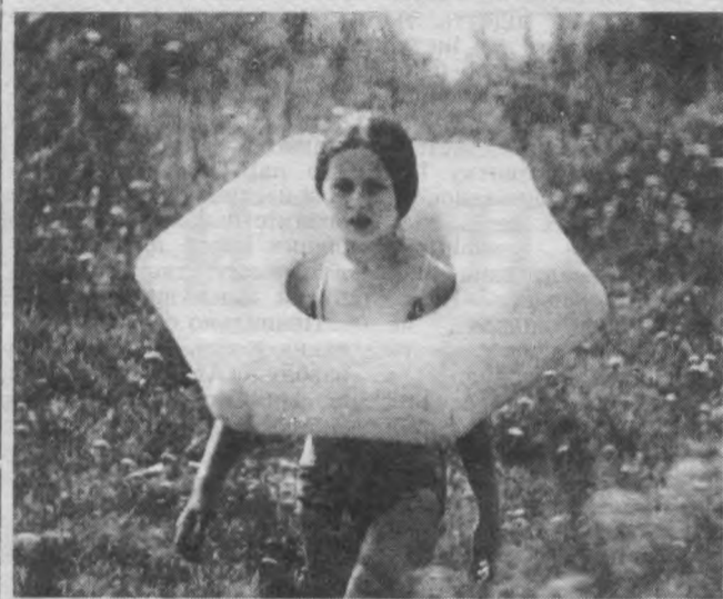
У розпалі літо.

Добре, що на концерті були представлені танцювальні номери і, що відрадно, у виконанні і дорослих і дитячих колективів. Та й в цілому треба сказати, що визначальною рисою свята стала різножанровість. Безперечно, велику роль відіграли вокальні ансамблі. М'яка, лірична манера відзначала спів жіночого вокального ансамблю радгоспу імені Кірова, з майже професійною майстерністю виступив фольклорний ансамбль Великодимерського сільського будинку культури «Калинонька».