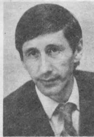
Наказом прокурора УРСР від 29 червня 1987 року на посаду