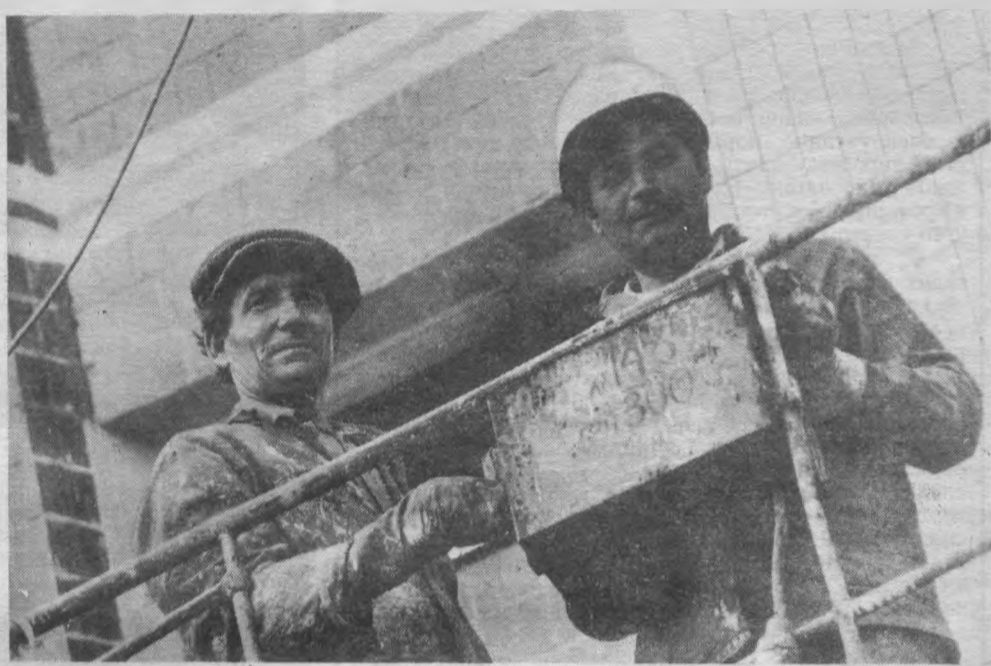
На спорудженні 48-квартирного будинку у селі Плоске ударними темпами працюють будівельники із БМУ-1 «Київміськбуд». За короткий строк завершені