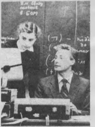
Львівська обласна мережа інформативних та обслуговувальних технічних організацій в середній школі села Великосілля Кам'янсько-Бузького району. На 12 робочих місцях діти колгоспників місцевого колгоспу «Україна» вивчають будову, роботу з клавіатурою, введення інформації в машину, освоюють ази програмування задач з математики, фізики, хімії тощо. На знімку, учні 9 класу на факультативних заняттях.