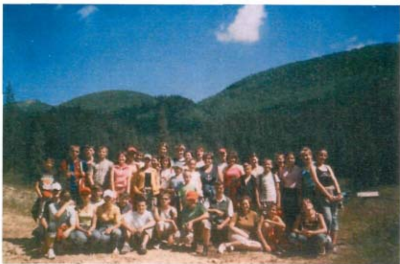
Під час екскурсії Верховиною