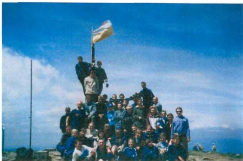
Мізоцькі школярі покорили Говерлу