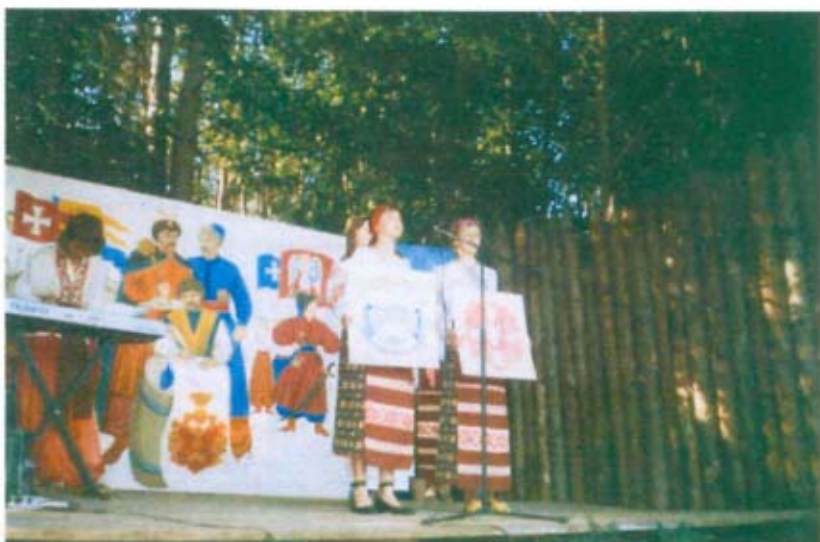
Мізоцькі ліцейсти – учасники Міжнародного фестивалю козацької слави на полі Берестецької битви