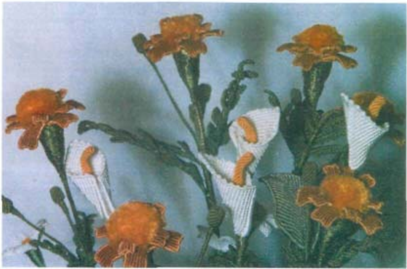
Квітковий рай Ольги Нечасвої