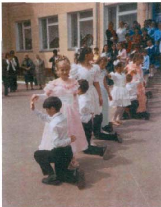
Перший шкільний випускний