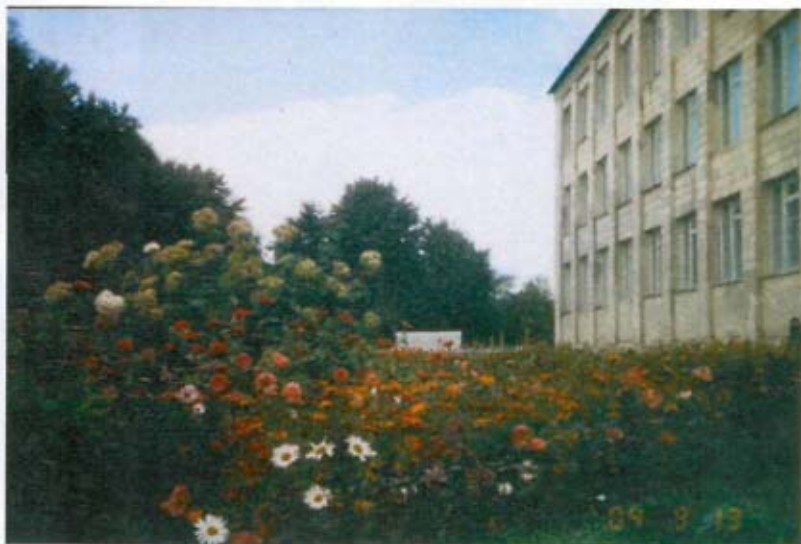
Потопас школа в квітах