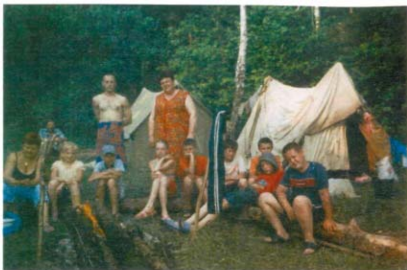
Мізоцькі ліцеїсти – вмітривалі туристи