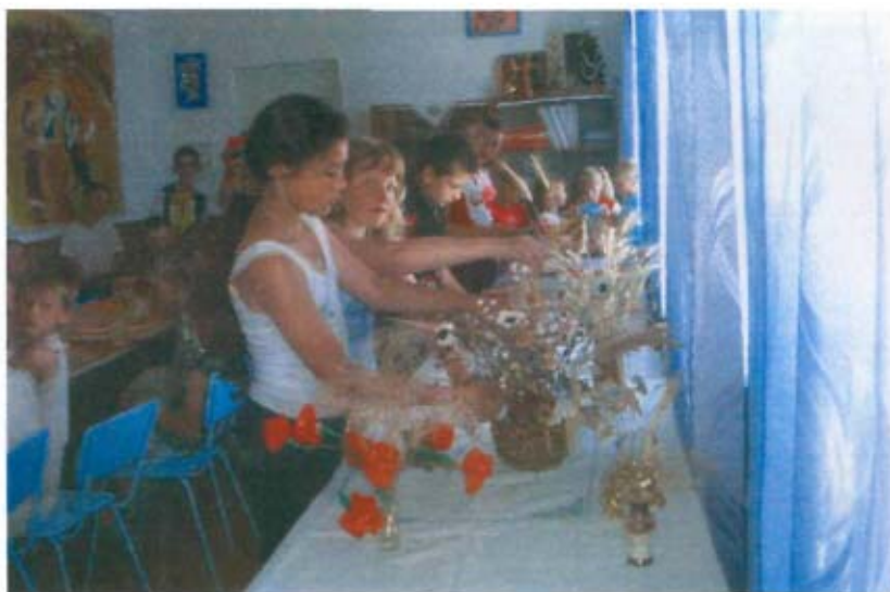
Конкурс декоративно-прикладного мистецтва