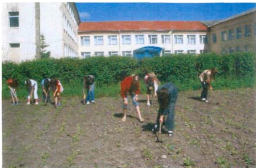
Експериментують юні натуралісти