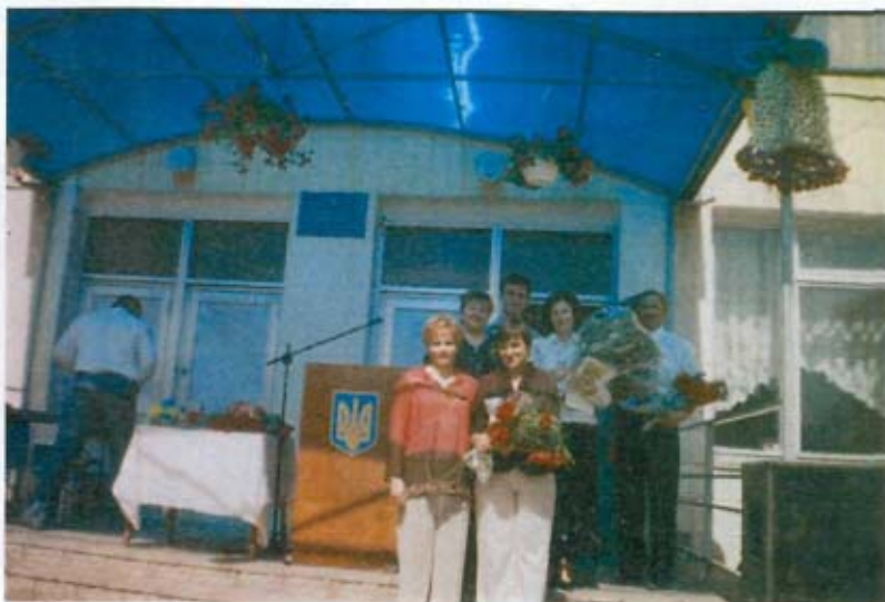
Свято Останнього дзвоника