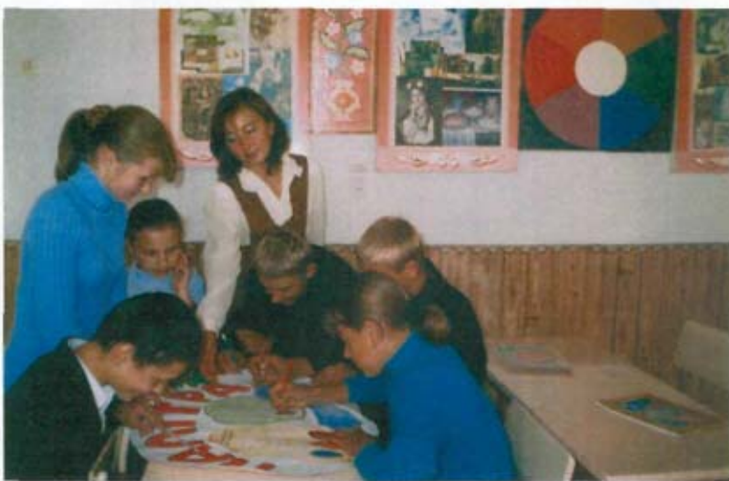
Заняття художньої студії