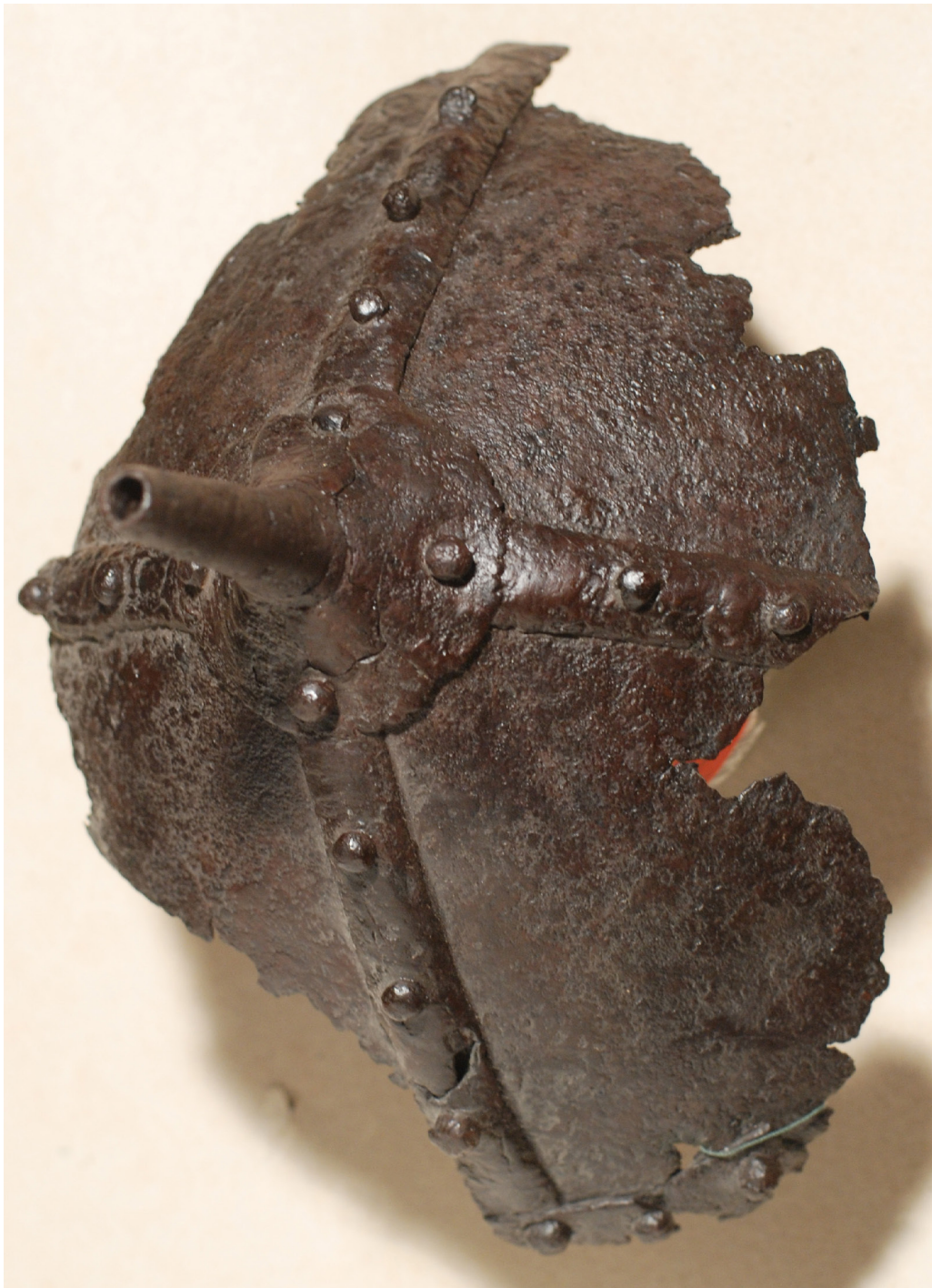
Рис. 4. Захисне нагопів'я в експозиції ЧОКМ.