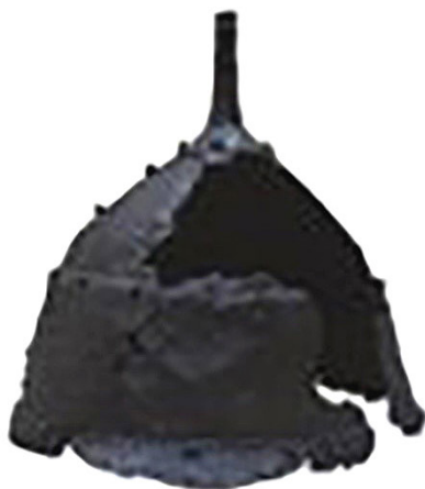
Рис. 6. Шолом Черкаського обласного краєзнавчого музею (Україна); шолом Херсонського краєзнавчого музею (Україна); шолом історичного музею «Іскра», м. Казанлик (Болгарія).