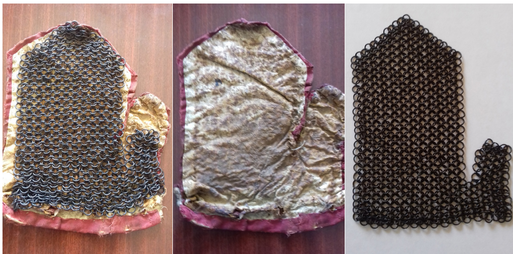
Рис. 3. Кольчужна рукавиця з колекції ЧОКМ.