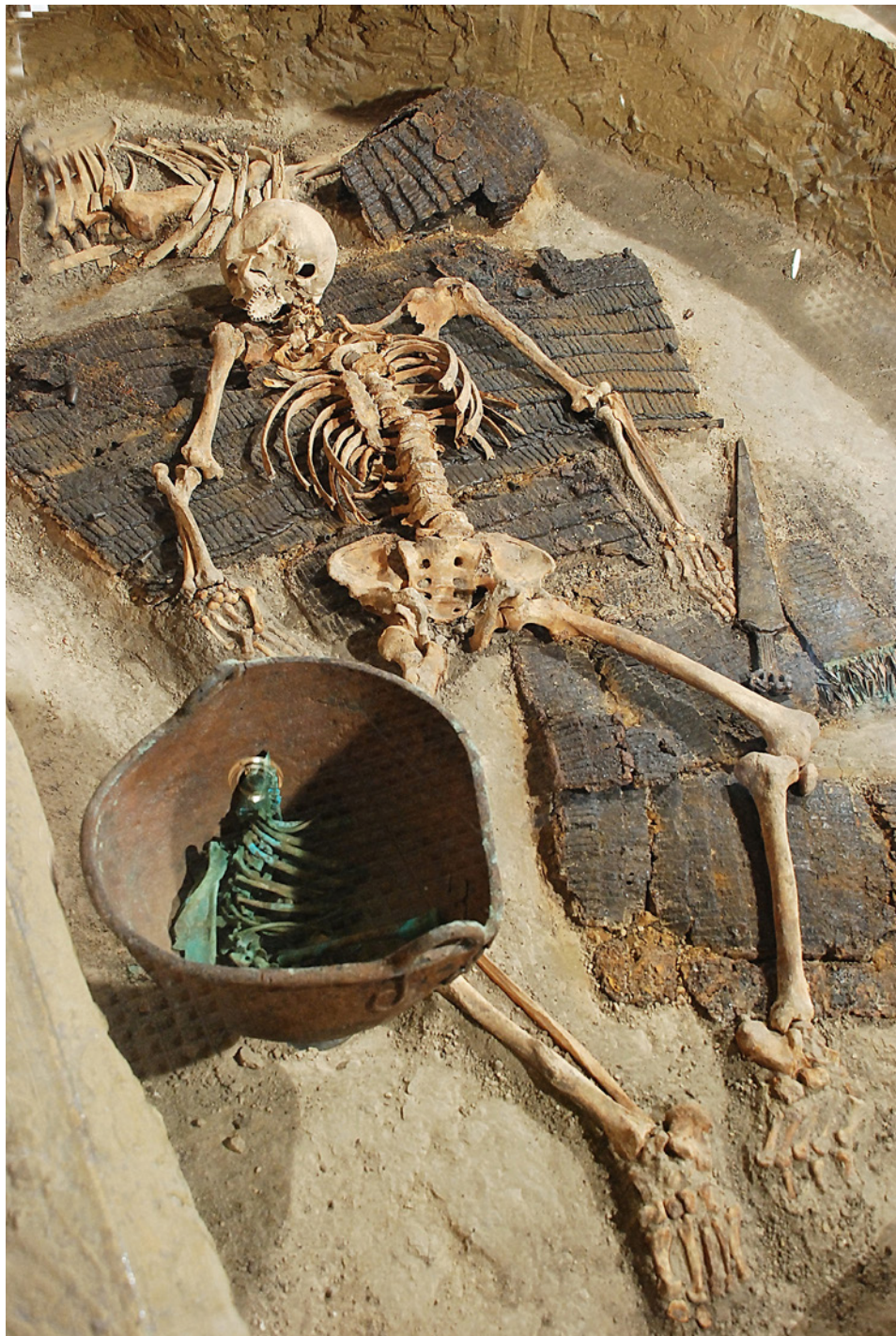
Рис. 1. Захисний обладунок поховання скіфського воїна V ст. до н. е. з кургану №2 біля села Гладківщина Золотоніського району в експозиції залу №6 ЧОКМ.