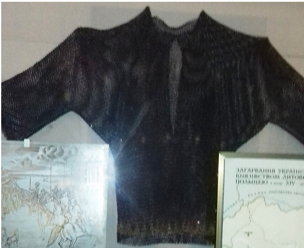
Рис. 2. Панцир кольчужний в експозиції ЧОКМ.