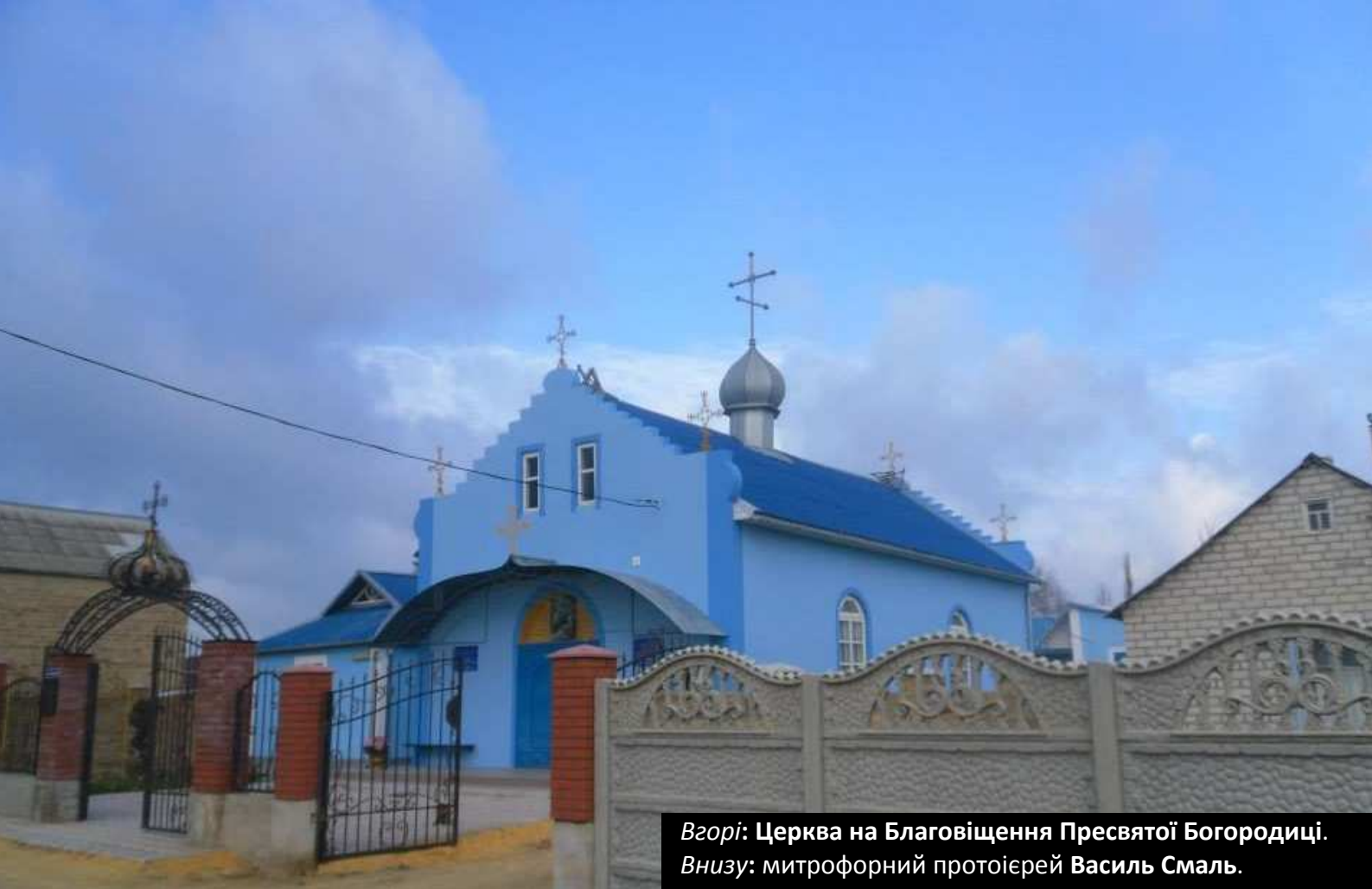
Вгорі: Церква на Благовіщення Пресвятої Богородиці. Внизу: митрофорний протоієрей Василь Смаль.