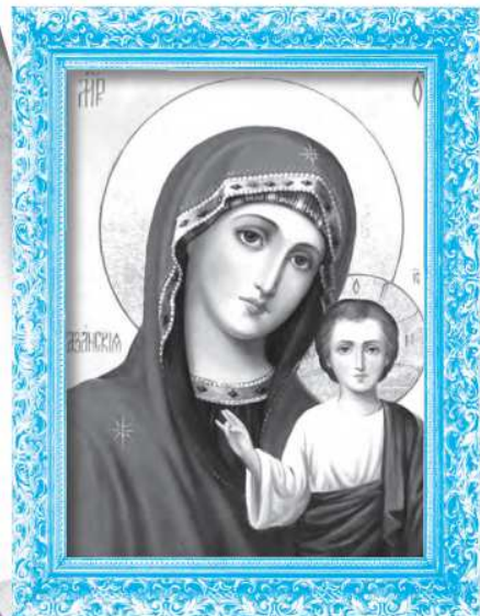
ПРЕСВЯТАЯ БОГОРОДИЦА, СПАСИ НАС!