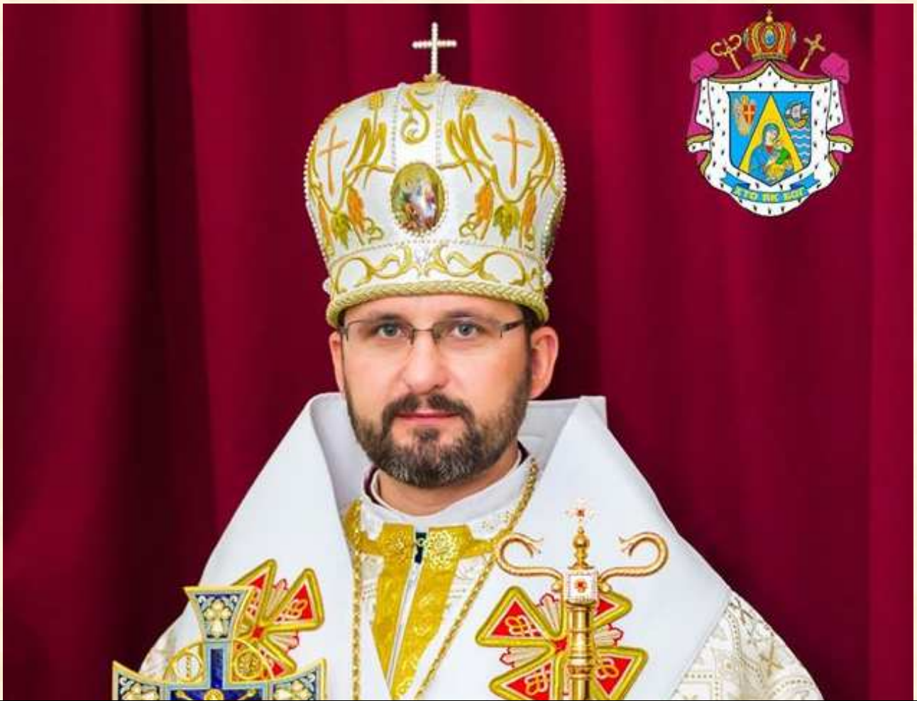
Вгорі: єпископ-екзарх Одеський Михаїл Бубній . Внизу: Одеський екзархат УГКЦ на карті України (позначено Чорнобаївку ).