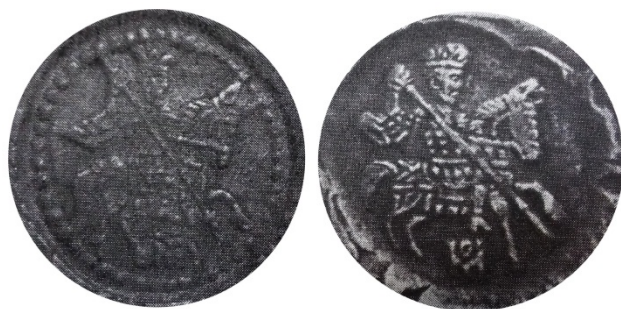
Рис. 13. Два різновиди надкарбувань штемпеля копійки на ефімках з ознаками 1 .