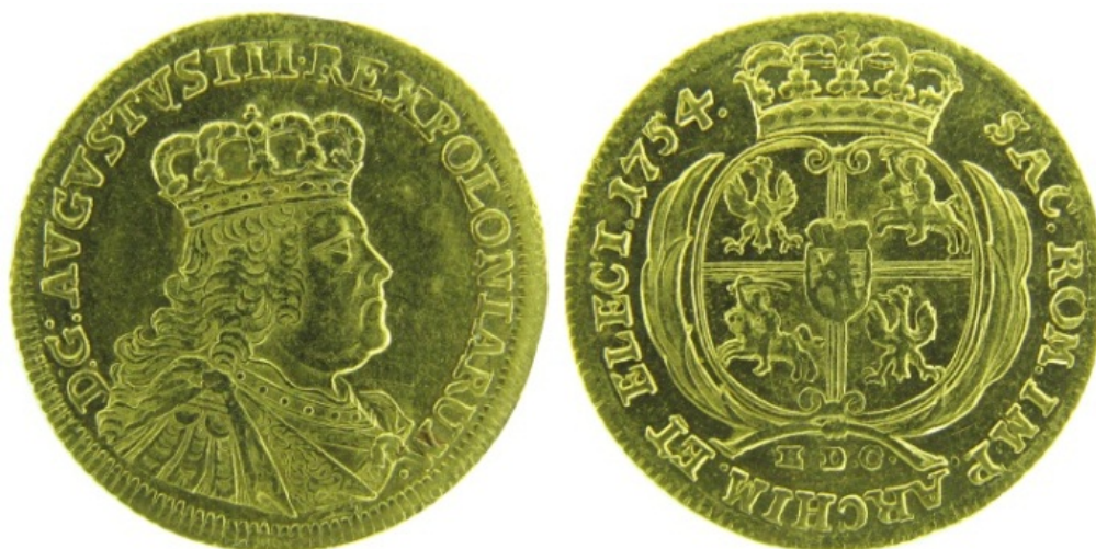
Рис. 2. Річ Посполита, Август III Саксонський, дукат 1754 р. 1 . НМІУ, Інв. № AU-527.