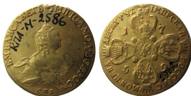
Рис. 39. Російська імперія. Єлизавета Петрівна. Червінець 1759 р. Золото, вага 16,34 г. НКПІКЗ. Інв. № КПЛ-м-2586;