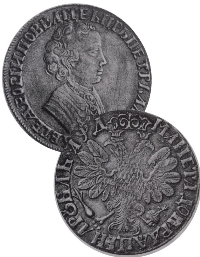
Рис. 4. Московія, Петро I, рубль 1704 р., м.д. Москва, з легендою реверсу МАНЕТА ДОБРАЯ ЦЕНА РУБЛЬ 1704 2 .