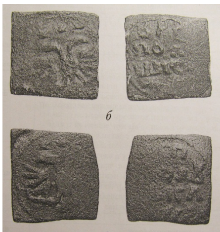
Рис. 31. Полушки Петра I квадратної форми з матеріалів РДАДА 1 .