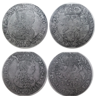
Рис. 40. Імітації шостака Речі Посполитої із датою «1660» 1 .