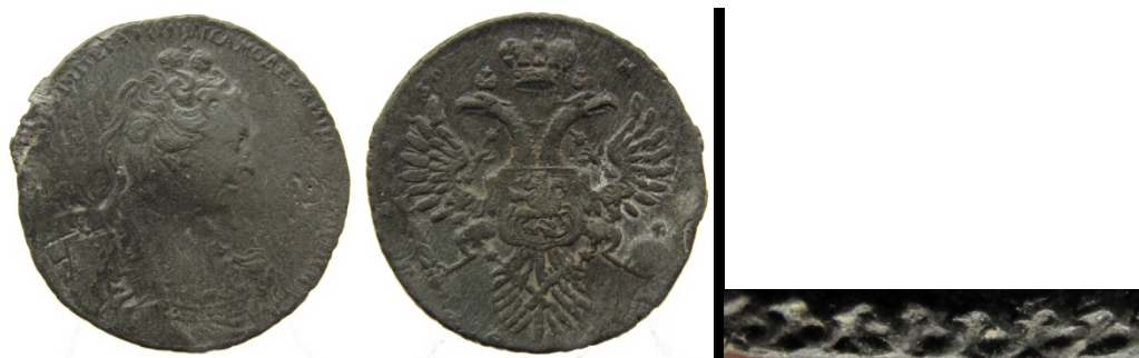
Рис. 34. Російська імперія, тогочасна підробка рубля часів Катерини I. Приватна колекція.