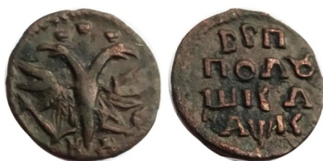
Рис. 27. Полушка Петра I з датою «1720», підробка того часу.