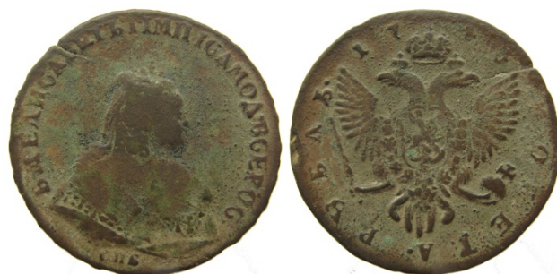
Рис. 37. Російська імперія, тогочасна підробка рубля 1740 р.