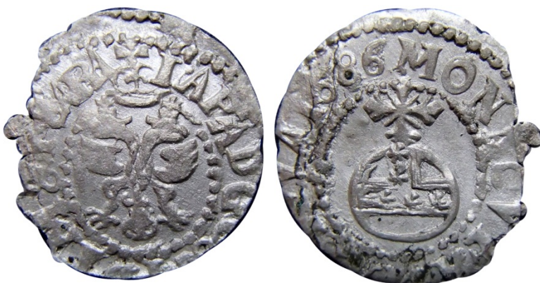
Рис. 18. Севський чех 1686 р. Знайдений у Чернігівській обл., Борзнянський р-н, берег р. Сейм.