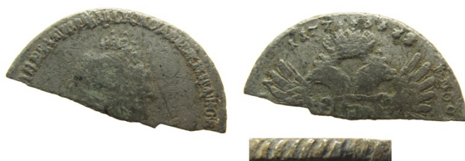
Рис. 35. Російська імперія, тогочасна підробка рубля 1733 р. часів Катерини I, фрагмент. Приватна колекція.