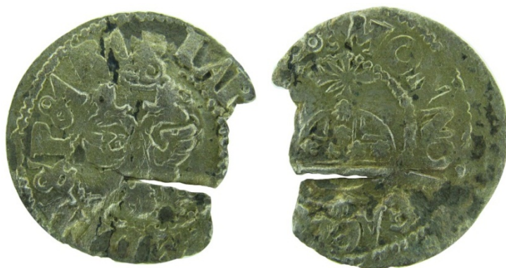
Рис. 19. Севський чех 1686 р. із колекції НМІУ 1 .