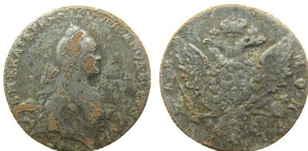
Рис. 36. Російська імперія, тогочасна підробка рубля 1766 р. часів Катерини II. Приватна колекція.