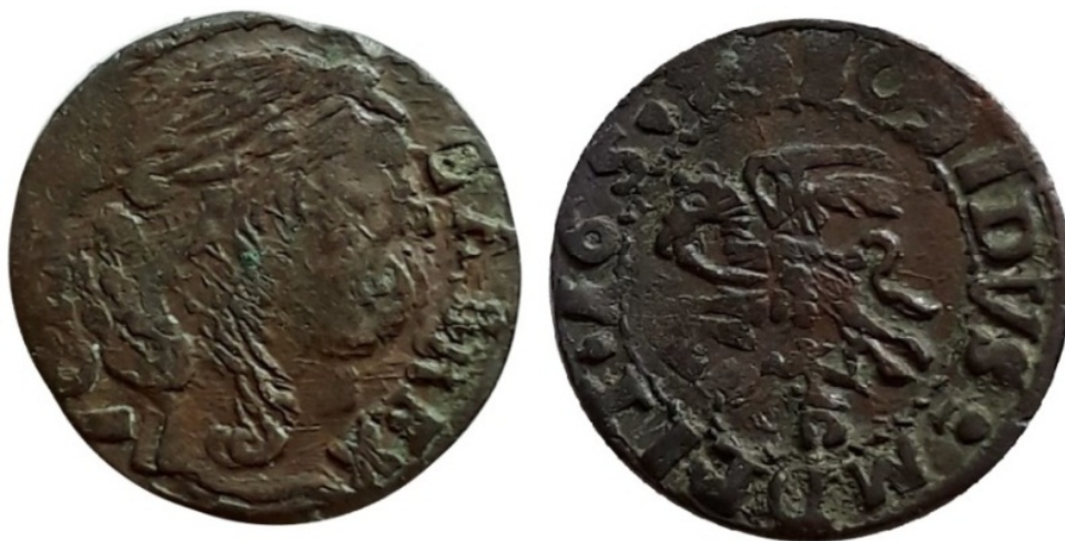
Рис. 10. Імітація солідів Сучави, виконана із застосуванням малюнків аверсу та реверсу польсько-литовського мідного соліду Яна II Казимира та білонового соліда 1652-1653 рр. (Рис. ) 1 .