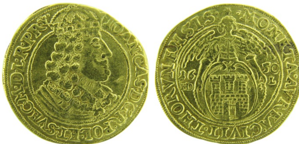
Рис. 1. Річ Посполита, Ян II Казимир, дукат 1650 р., м.д. Торунь. НМІУ, Інв. № AU-516.