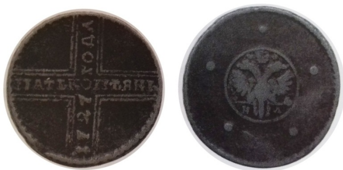
Рис. 32. Російська імперія, 5 копійок 1727 р. з легендою «КОПЕЯКЪ» 2 .