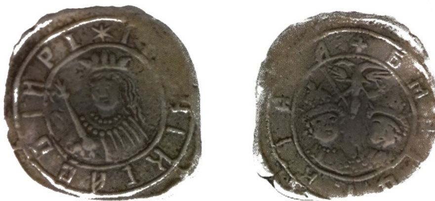
Рис. 16. Московія. Іоанн та Петро Олексійовичі під регентством царівни Софії. Алтин. Знахідка: Чернігівська обл. 1 .