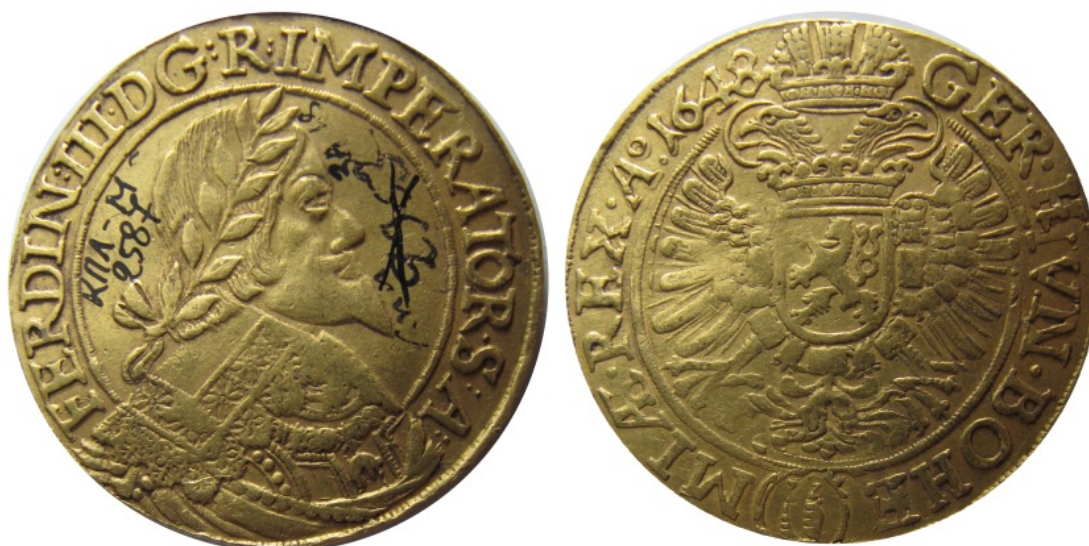
Рис. 7. Богемія, португал (10 дукатів) 1648 р. НКПІКЗ. Інв. № КПЛ-м-2587 1 .