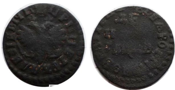
Рис. 28. Деньга Петра I, карбовна 1712 р.