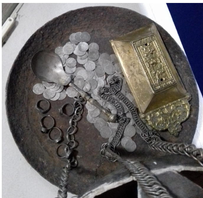
Рис. 12. Скарб монет із с. Пекарі. Експозиція НМІУ.