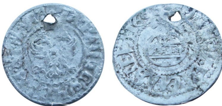
Рис. 17. Севський чех 1686 р. Знайдений у Волинській обл.