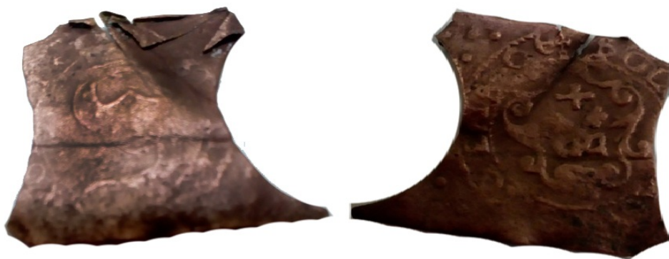
Рис. 9. Сучава, імітація ризького соліду кін. XVII – поч. XVIII ст. із залишками виробничого ажурю. Приватна колекція.