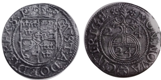
Рис. 3. Шведська окупації Балтії, Густав II Адольф, драйпелькер 1624 р., м.д. Рига з легендою реверсу MON NOVA CIVI RIGE 1 .