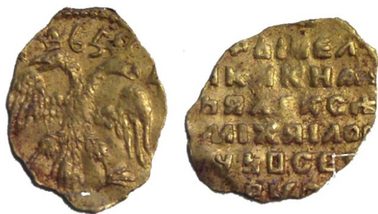
Рис. 15. Московія. Олексій Михайлович. Золотий у \frac{1}{4} угорського. 1665 р. Знахідка: м. Корсунь-Шевченківський.