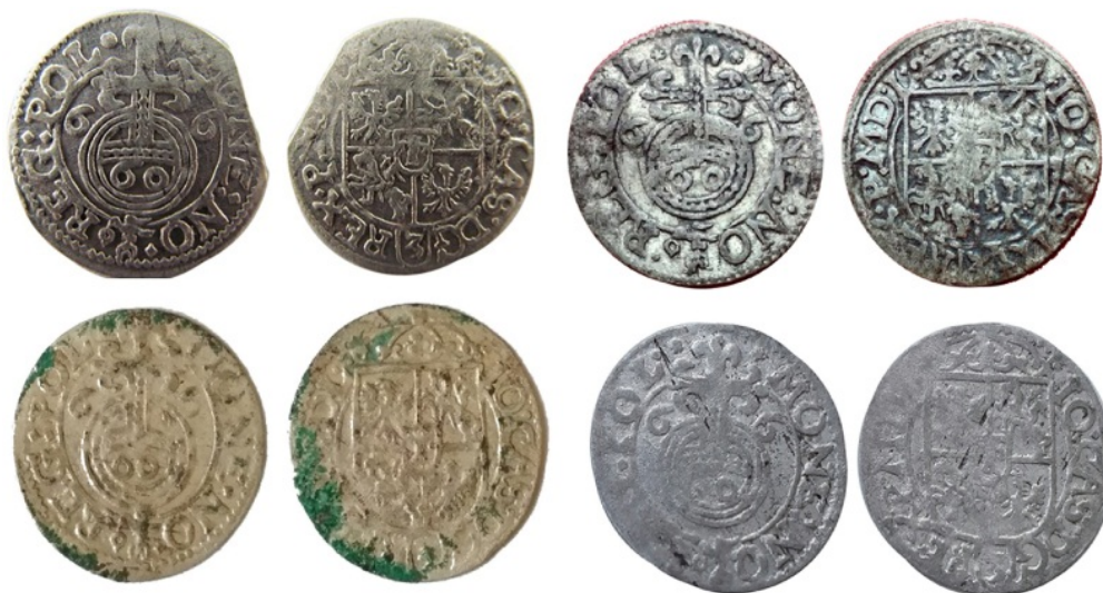
Рис. 8. Нові знахідки півтораків Яна II Казимира, карбовані у 1666 р.