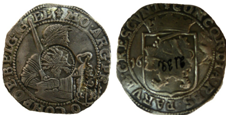
Рис. 14. «Єфімок з ознаками» із колекції НІЕЗ «Переяслав» 2 .