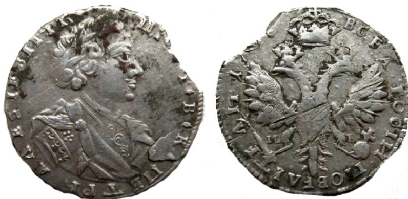
Рис. 29. Тимф 1708 р., Петро I 1 . Вага: 6,70 г.