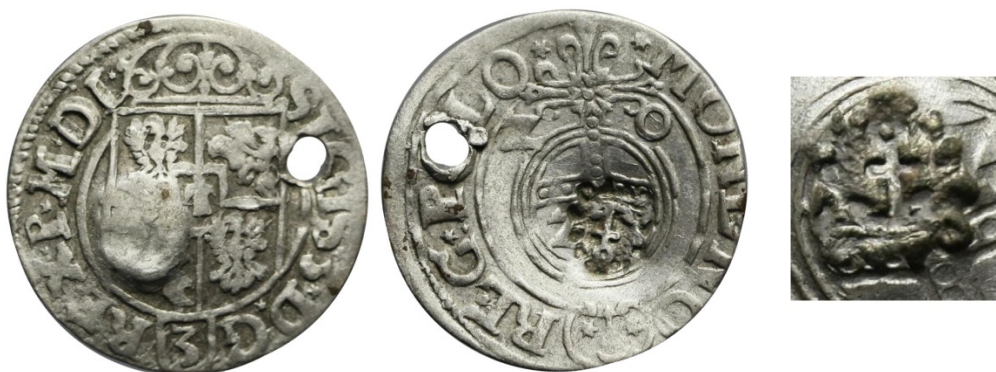
Рис. 21. Річ Посполита, Сигізмунд III Ваза. Півторак 1620 р. м.д. Бидгоць із контрамаркою у вигляді якоря.