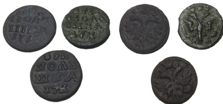
Рис. 26. Комплекс полушок Петра I з монетою з перегравіруванням дати «178».