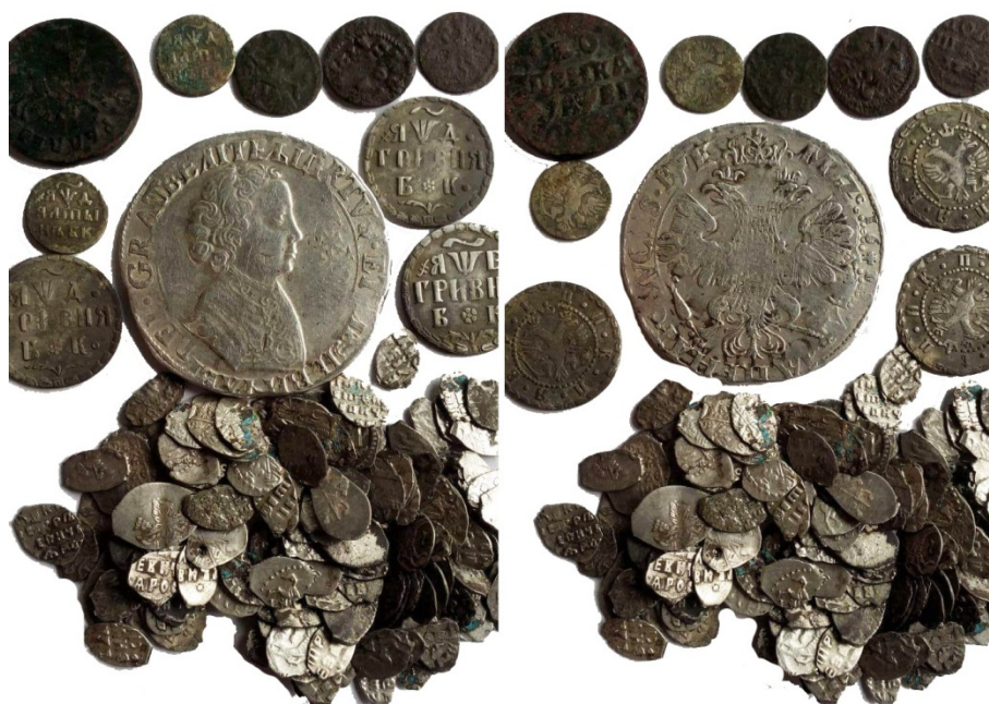
Рис. 25. Скарб монет Петра I.