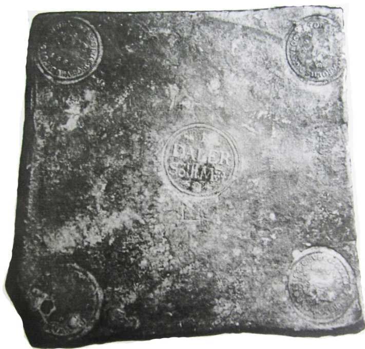
Рис. 11. Швеція, 1 далер 1669 р.. Колекція ОАМ 1 .