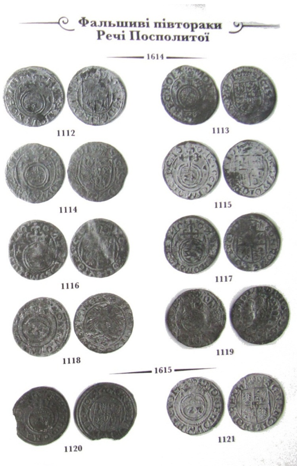
Рис. 41. Імітації півтораків Речі Посполитої, виготовлені з низькопробного срібла 1 .