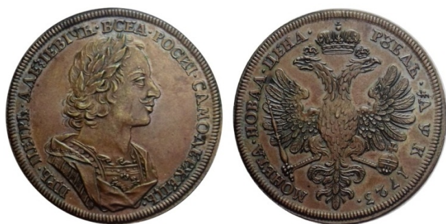
Рис. 33. Російська імперія, Петро I, пробний карбованець із міді. Аукціон Sincona 3 .