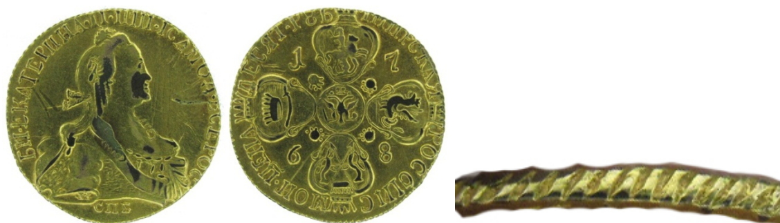
Рис. 38. Російська імперія, Катерина II, червінець 1768 р. Мідь, позолота. Вага 11,62 г. Зібрання НМІУ.