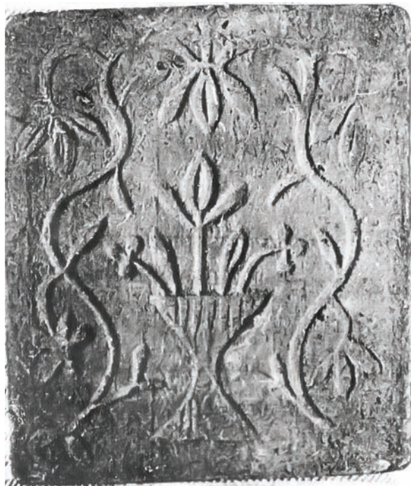
Іл. 2. Кахля лицьова. Глина, тиснення у формі. с. Рашівка Гадяцького р-ну Полтавської обл. Друга половина XIX ст. НМНАПУ. Інв. № КС-4828.

У 1979 році колекція Музею поповнилася 23 кахлями із сіл Забрідки, Кунцеве, Ключівка, Зачепилівка Новосанжарського району Полтавської області (інв. № КС-4498—4517). Усі вони орнаментовані ромбами, заведеними в чотирикутну рамку, датуються кінцем XIX ст. Цікавий декор має кахля із с. Кунцеве (інв. № КС-4528). Цінність такої кахлі в колекції НМНАПУ визначається особливим відтиском узору. Прикрашена вона вазоном із трьома квітками, по боках якого розташова-