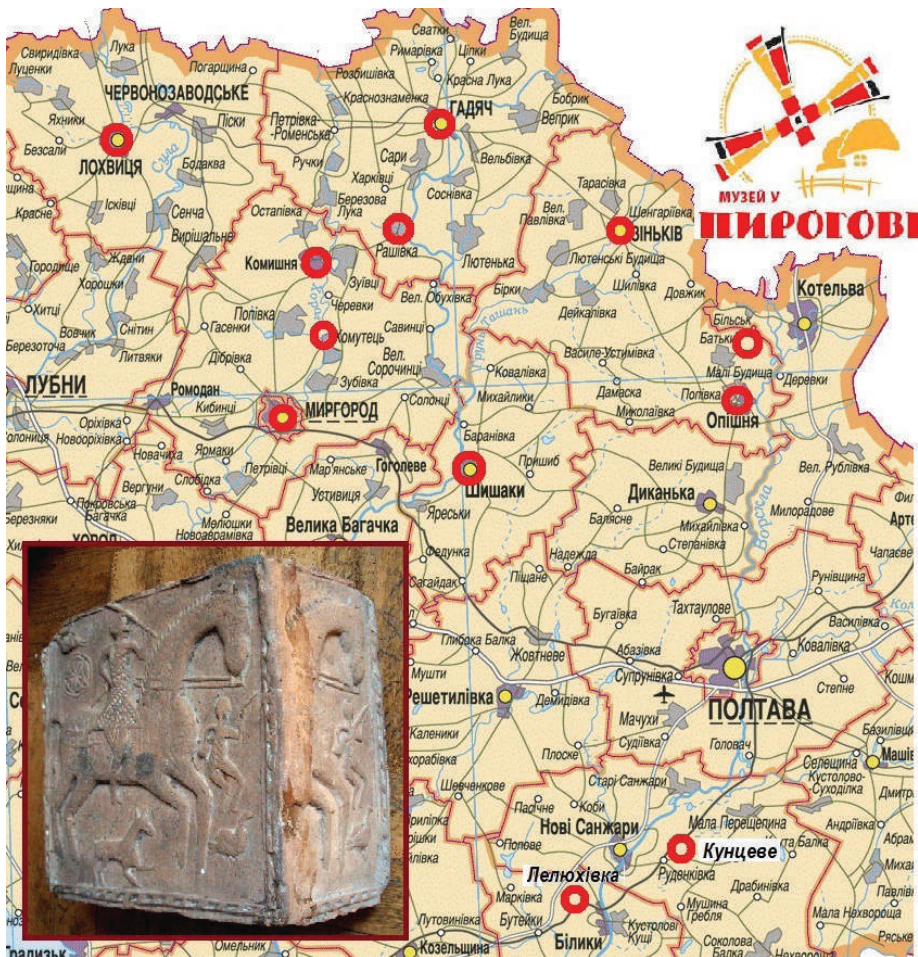
Іл. 1. Карта обстежених науковцями НМНАПУ осередків кахлярства Полтавщини.

ної кераміки XVI – першої половини XX століть», у якому авторка згадує кахлі зі збірки НМНАПУ (інв. № КС-4828, КС-5194, НД-2317) (іл. 2, 4).