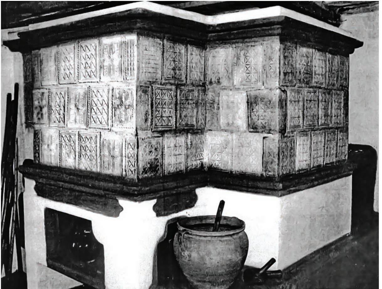
Іл. 5. Кахляна піч. с. Лелюхівка Новосанжарського р-ну Полтавської обл. Друга половина XIX — початок XX ст. НМНАПУ, експозиція.

Під час експедиційного обстеження м. Миргорода та прилеглих сіл було знайде-