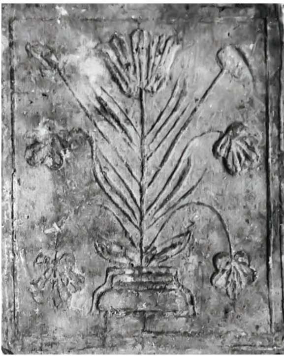
Іл. 6. Кахля лицьова.

Глина, тиснення у формі. с. Кунцево Новосанжарського р-ну Полтавської обл. Кінець XIX ст. НМНАПУ. Інв. № КС-4528.