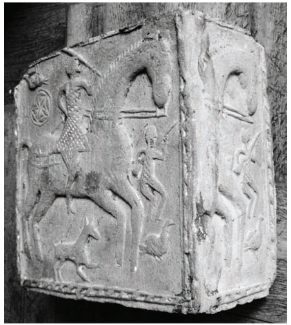
Іл. 9. Кахля кутова. Глина, тиснення у формі. Полтавська обл. Кінець XVII ст. (?). НМНАПУ. Інв. № КС-6971.

Підсумовуючи величезну роботу, яку провели науковці НМНАПУ для створення колекції неполив'яних кахель Полтавщини, можна сказати, що ця збірка є вагомим внеском у загальну музейну та культурну спадщину України. Процес формування колекції триває і надалі, хоча дедалі менше можна віднайти такі примірники кахлярства, якими володіє Музей, у сучасних селах Полтавщини. Цінність зібраної колекції не викликає сумніву в дослідників, які вже частково висвітлювали її у своїх працях і далі опрацьовуватимуть величезний фактичний та інформативний матеріал, накопичений у запасниках Музею. Традиційні рельєфні кахлі з музейної збірки НМНАПУ — безмежний