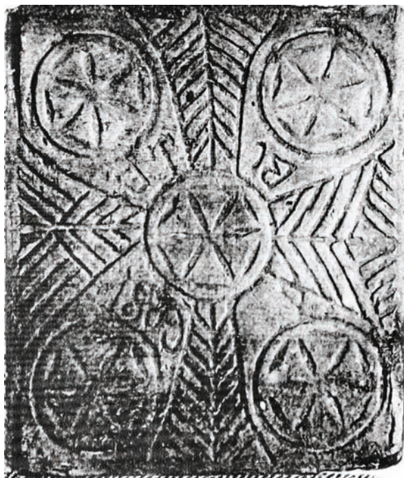
Іл. 3. Кахля лицьова. Глина, тиснення у формі. с. Рашівка Гадяцького р-ну Полтавської обл. Друга половина XIX ст. НМНАПУ. Інв. № КС-6127.