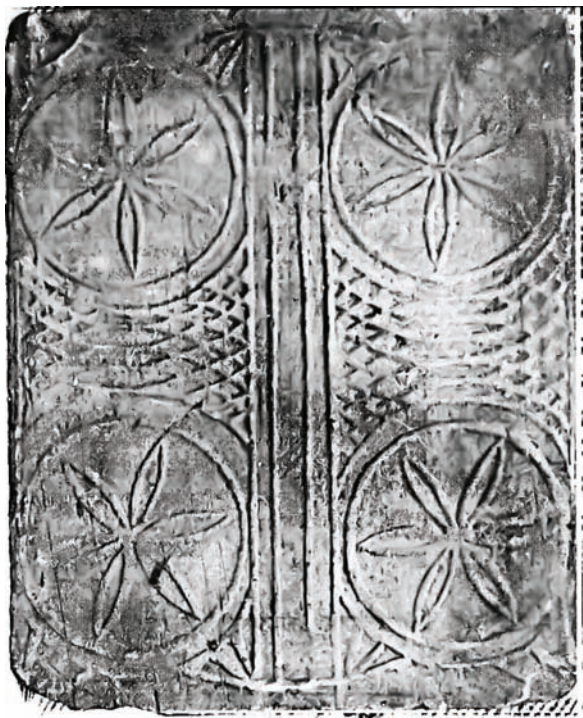
Іл. 4. Кахля лицьова. Глина, тиснення у формі. с. Хомутець Миргородського р-ну Полтавської обл. Кінець XIX ст. НМНАПУ. Інв. № КС-5194. Світлина В. Савича

но хвилясті стебла з листям, угорі над вазоном — ще одна велика квітка. Саме цю кахлю 2007 року вперше в літературі опублікувала у своїй праці «Декор української народної кераміки XVI — першої половини XX століть» Г. Івашків [1, с. 272] (іл. 6).