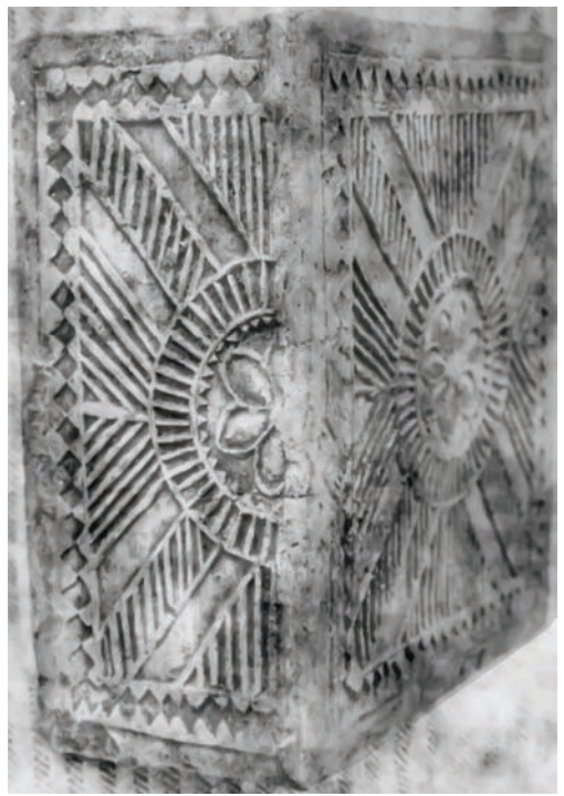
Іл. 7. Кахля кутова.

Глина, тиснення у формі. с. Кунцево Новосанжарського р-ну Полтавської обл. Кінець XIX ст. НМНАПУ. Інв. № КС-4528. Світлина В. Савича