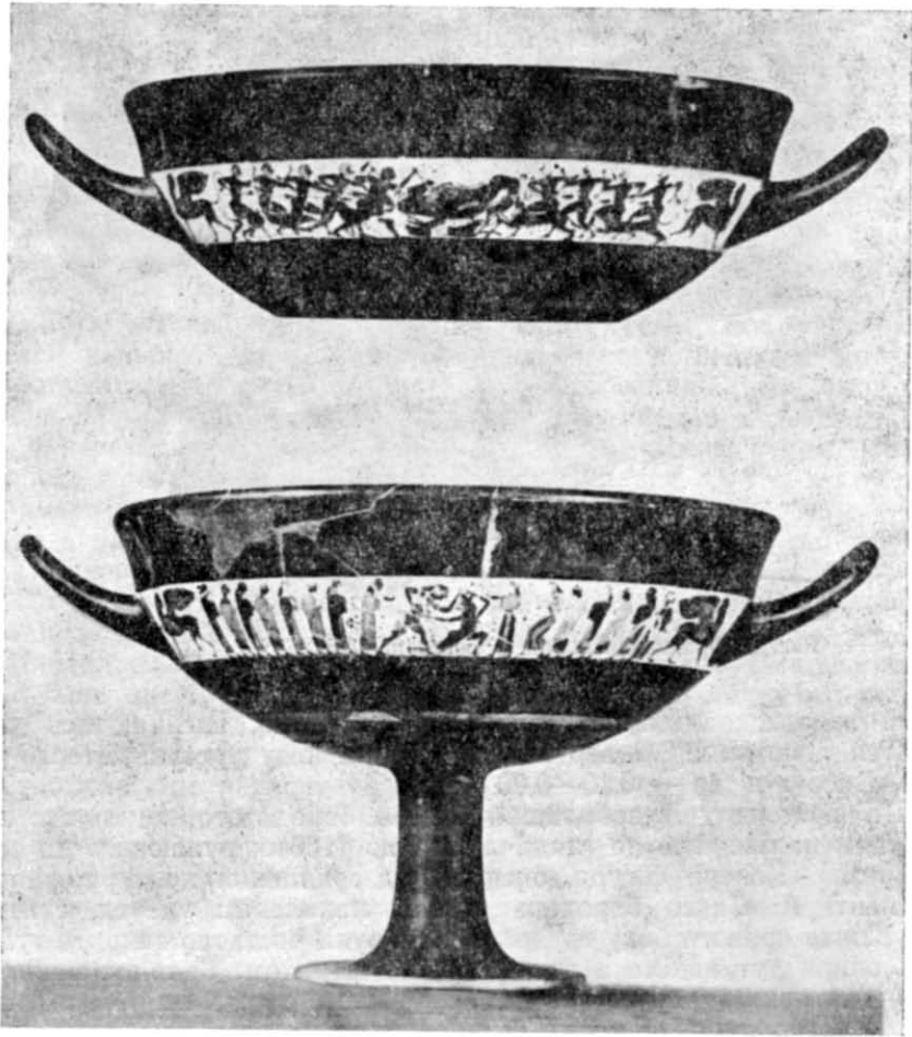
Рис. 2. Кілик Главкіта і Архікла, Музей Антікваріум у Монако.

важко присідаючи на задні ноги. Передні ноги піднесені і перетинаються. На правому коні збереглася нога вершника, під животом лівого — опущений додолу спис.