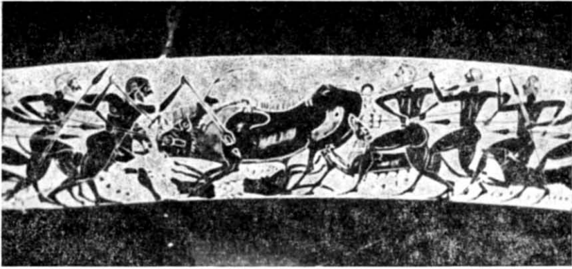
Рис. 3. Фрагмент фризу кілика Главкіта і Архікла.

героїв неможливий серед групи мисливців, то найреальніше припустити належність фрагмента В другому боці чаші.