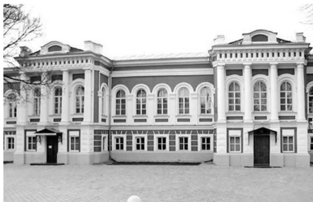
Глухівський національний педагогічний університет ім. О. Довженка

За її свідченням, декілька вечорів з читанням заборонених книг друзі-студенти присвятили пам'яті Т.Г. Шевченка, і присутні, будучи в захваті від почутого, довго-довго ще потім не розходились по домівках.