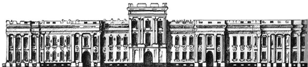
Глухів. Будинок Малоросійської колегії

Найстарішим пам'ятником архітектури, що зберігся до наших днів, глухівці називають Миколаївську церкву. Спорудив її «кам'яних справ майстер» Матвій Єфімов. У цій величній будові, як твердят солідні знавці, йому пощастило втілити кращі риси української архітектури XVII століття,