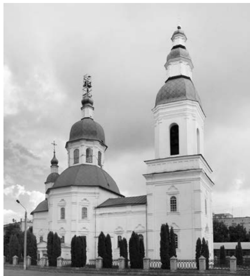
Глухів. Миколаївська церква

«Цю школу я вибрав тому, – зауважував він пізніше, – що мав право «складати туди іспити», а по-друге, там були