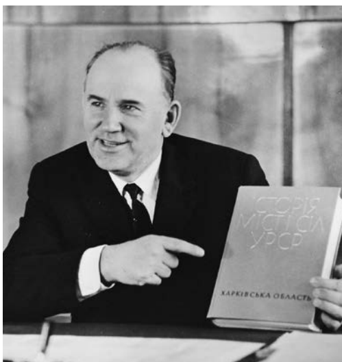
П. Т. Тронько

У 1978 році П.Т. Тронько був обраний академіком і віце-президентом АН УРСР, працював завідувачем відділу історико-краєзнавчих досліджень Інституту історії АН УРСР, виконував обов'язки президента Міжнародного комітету славистів, був головою і членом багатьох редакційних колегій, наглядових і координаційних рад, організатором проведення заходів з питань історико-