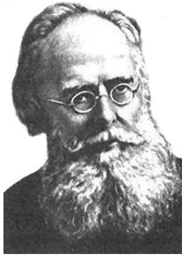
Олександр Опанасович Потебня

Роменського повіту Полтавської губернії (тепер село Гришине Роменського району Сумської області). Видатний український мовознавець, філософ, фольклорист, етнограф, літературознавець, педагог, громадський діяч, член-кореспондент Петербурзької АН з 1875 р., член багатьох (зокрема, зарубіжних) наукових товариств. Брат військового та політичного діяча Андрія Потебні. Батько українського ботаніка Андрія Потебні та українського електротехніка Олександра Потебні.