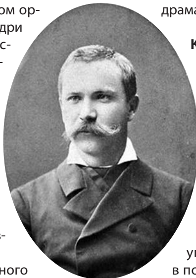
Іван Карпович Тобілевич

29 – 170 років від дня народження Івана Карповича Карпенка-Карого (Тобілевича) (1845–1907), українського драматурга