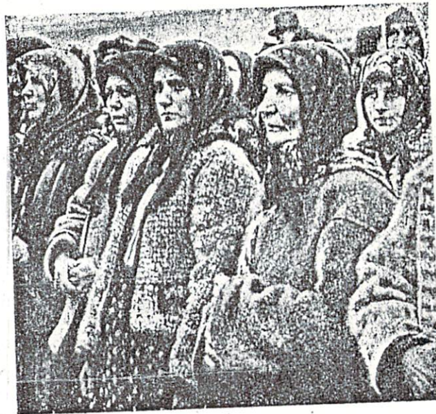
Жіночі типи бойкін.

меона Бекбулатовича, первісно Сайн-Булата і татарчуків Івана Грозного і Бориса Годуноффа, потомка татарського мурзи Чета, часом Даніяра, Муртази, Махмет-Аміна, Шейх-Авліяра, Абдулага, Тохтаміна, Ядігара і інших московських князів, але татар з походження, часи, коли татари стали закладати роди московської найвищої шляхти, Урусоффих, Самтікоффих, Тургенєвих, Семіоноффих, Карачинських, Апраксінних, і роди низшої шляхти, коли Москва також «сколонізувала» Сибір і Далекий схід, не на протязі