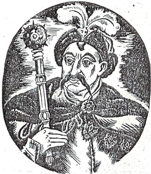
Гетьман Богдан Хмельницький, 1648—1657.

ніхто у світі". „Козаки добрії мисли мали й ворога воювали“, — як співається в пісні. Свідомість основ козацької національної сили видно зо слів думи Мазепи: „Нехай вічна буде слава, що през шаблі мавм права“. „Тимто була колись страшна козацька сила, що була в нас воля і дума єдина“ — як читаємо в козацькій думі. Про потребу одного сильного проводу, одного володаря-вождя вказують слова Петра Дорошенка „Аби було єдино стадо і єдин пастир!“ Знову ж Мазепа каже у своїй думі таке про потребу одного сильного вождя-проводника нації: „сам керуєть стерник і сам управуєть.“