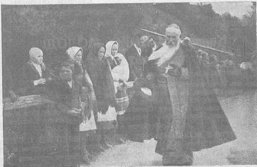
Український Владика ВПреосвященний Кир Йосафат Коциловський, звиджує дорогу Його батьківському серцю українську Лемківщину.

дику тисячні вірні в Горличчині, Стрижівщині, або з яким душевним розположенням принимали тисячі паломників і вірних у Кальниці, біля Балигороду, з його рук Найсвятіші Тайни, в часі св. Місії, що її провадив у своїй парохії о. кан. Теодор Хомко, або як ревно плакали парохіяни села Синева, біля Риманова, коли наш Владика приїхав на закінчення св. Місії, та знаючи, що в Риманівщині шириться безбожництво й комуна, звернувся Він до зібраних зі словами: „Перекажіть цим усім, що наслідують з Хри-