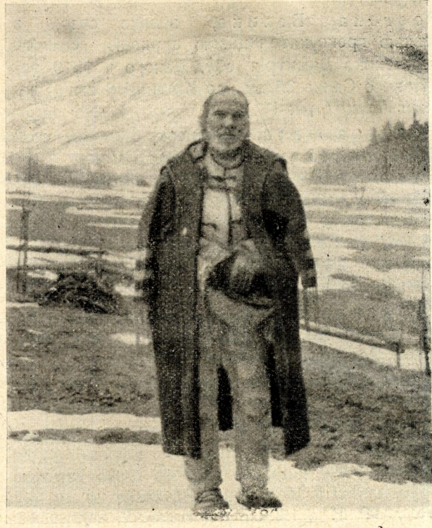
Старенький дідусь з Висовій.

Согорів Горішній, українське село, дочерне парохії в Юрівцях (1 км.) у Сяніцькій Окрузі; поселене в XIV. сторіччі.