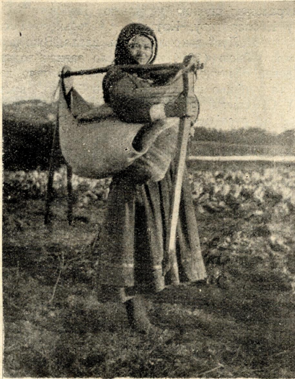
Молода мати вертає з дитиною з поля до хати у Висовій.