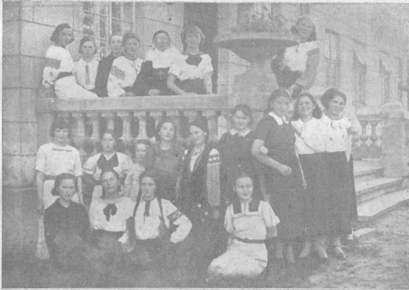
Українські учениці з Лемківщини при Манастирі СС. у Львові.

Річно 3 зол., Піврічно 1.80 зол., Чвертьрічно 1 зол. ЗАКОРДОНОМ: Річно 1 ам. дол. або рівновартість.