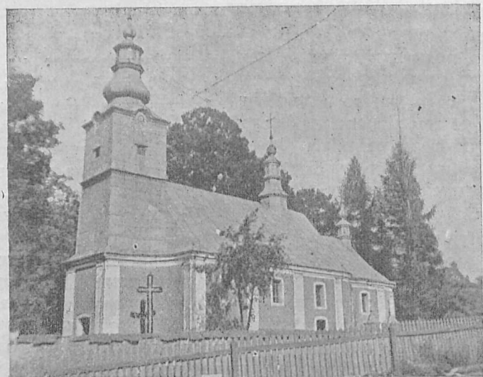
Українська греко-катол. церква в Маластові.