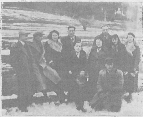
Члени Театральної Секції при Філії „Просвіти“ в Сяноці, в часі поїздки з виставою до українських сіл у Сяніччині.