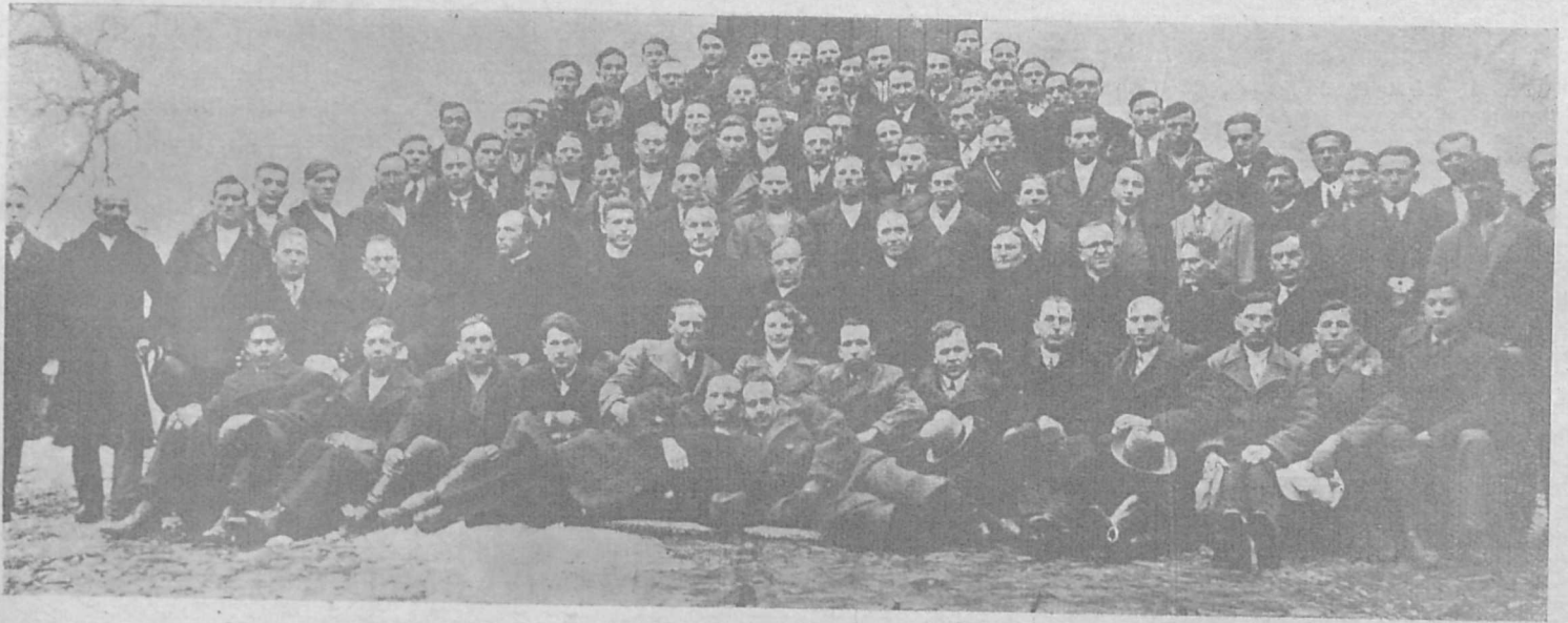
Учасники фахової весняної конференції Кооператорів у Сяноці, дня 29. III. 1937 р.

Річно 3 зол., Піврічно 1-80 зол., Чвертьрічно 1 зол. ЗАКОРДОНОМ: Річно 1 ам. дол. або рівновартість.