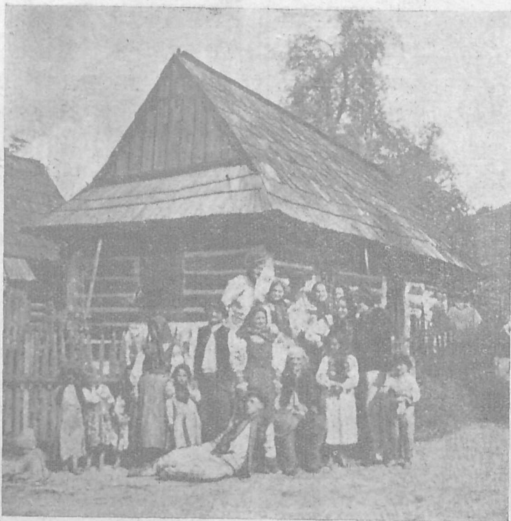
Українська родина в народніх строях у Білій Воді, к. Н. Торгу.