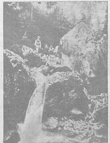
Малі Пеніни в Явірках.

бійки в лісі, на відтанку Тиляви, в т зв. Блудній. Барвінчани виїхали до ліса як звичайно, та тут тиллявни напали на них з сокирами і колами, що таки трохи потурбували солтиса з Барвінка та декотрих господарів, мовляв: ви не маєте тут права, то наш ліс.