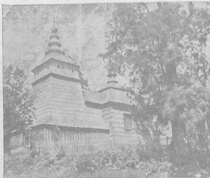
Гр. кат. церква в Бортині, коло Ронни Руської.

Лесь не був боягузом, але в ту мить йому зробилося так страшно і ніяково, що він наче задеревів на