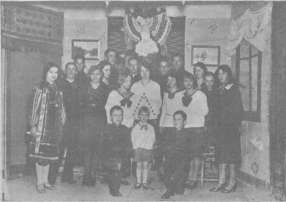
Українська Молодь в Новому Санчі — в честь Тараса Шевченка.

У вівторок 2. березня ц. р. вечором помер зовсім ненадібно професор Володимир Чайківський у Сяноці в 53-ому році життя. Покійний був у Сяноці понад 20 років професором української мови і літератури в польській гімназії, до якої ходить доволі багато української молоді. Якщо зважити, що Покійному доводилося працювати в чужому середовищі під час і по наших визвольних змаганнях та в атмосфері відомої політики на Лемківщині, тоді щойно можна уявити собі важку працю професора української мови та літератури. Однак Покійний поборював усі труднощі й чесно та совісно сповнював свій обов'язок українського педагога перед рідною молоддю, якій вціплював національну свідомість і любов до рідної мови та літератури. Крім того находив ще час на живу працю в культурно-освітніх наших товариствах у Сяноці, в яких брав живу участь як член виділів читалень „Просвіти“, Народного Дому і т. д.