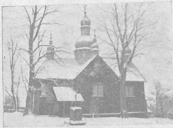
Греко-католицька церква в Зиндрановій.