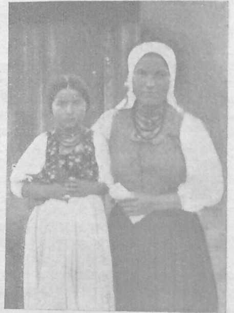
Українська мати з донечкою зо села Зиндранової к. Дуклі.

Загальні Збори читальні „Просвіти“ в Лубній відбулися дня 24. І. ц. р. У виділі лишилися старі члени. У звіттовому році було 4 вистави, 1 фестин. Перечитано 167 книжок різного змісту, з того жінок 76, мужчини 91. Цей рік буде кращий, бо вже скінчена будова своєї домівки. Помагай Бог!