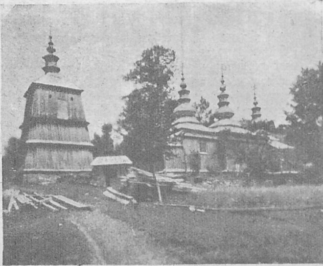
Українська гр.-кат. церква в Репеді (Команеччина), збуд. 1824 р.