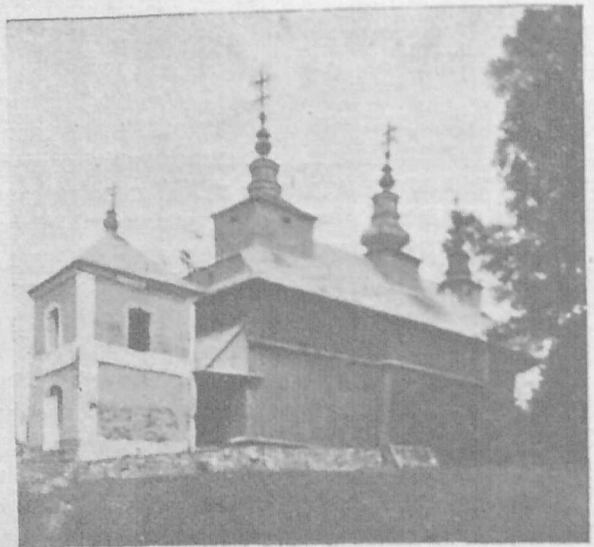
Українська гр.-кат. церква під покр. Всіх Святих у Мошанці (Риманівщина), збуд. 1834 р.