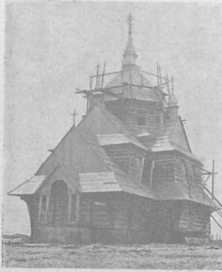
Новозбудована церква в Гладішові.

— Іспанія є й надалі тереном кривавих боїв і дальшої руїни та водночас є предметом міжнародних торгів. Національні війська здобувають п'ядь за п'ядею. З Мадриду червоні усунули цивільне населення, яке ще зосталось при життю. Сподіюється, що військо генерала Франка хоче окружити Мадрид з усіх боків і закинути малоуспішне збудування кожного будинку тимбільше, що це є нерівна боротьба. Червоні є добре поховані за муром, а націоналісти наступають нічим незаслоненими лавами. Далеко більші успіхи досягнуто на інших фронтах.