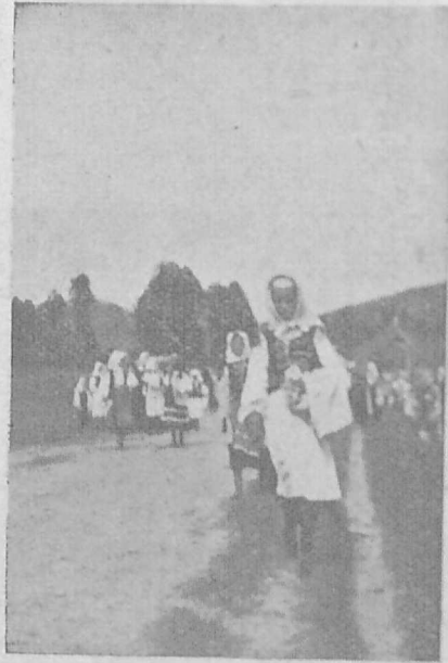
На відпуст до Смерека.

і в її skleпах: у Львові, Руська ч. 20. в Перемишлі, вул. Косцюшка ч. 5.