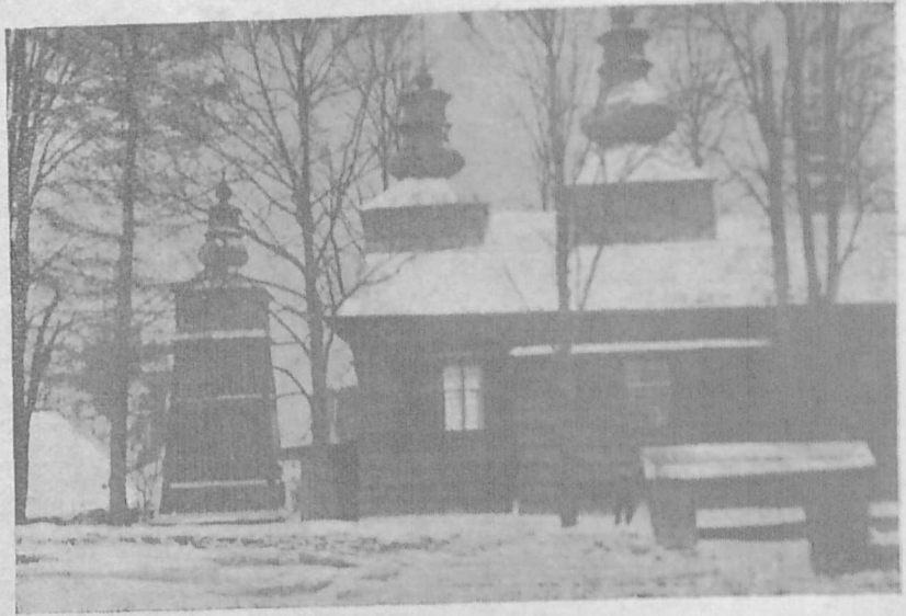
Гр. кат. церква в Тарнавці коло Риманова.