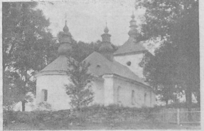
Греко-католицька Церква Рождества Пр. Богородиці в Тилявій, біля Барвінка, збу- дована в 1787 р., відновлена в 1931 р.