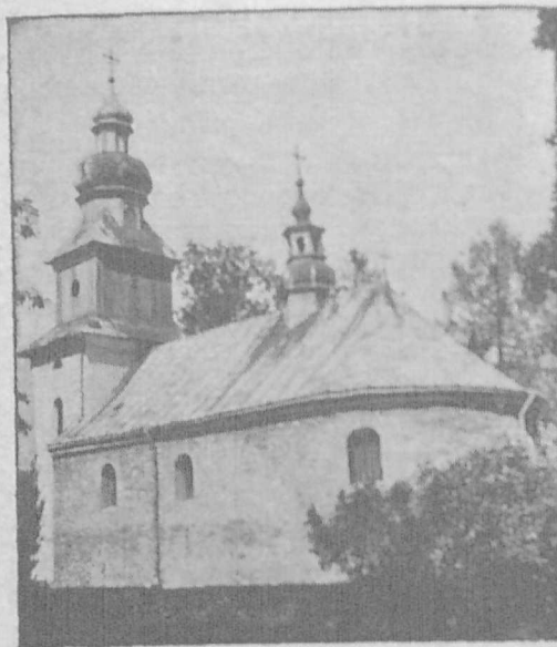
Гр.-кат. церква в Загір'ю.

ся майже в цілості в сучасних українських селах у Лемківщині. Криницька земля 2) стається впродовж віків тереном важних подій. Туди веде шлях на схід і південь, шлях забезпечений оборонними замками в Мушині, Ритрі, Чорштині; через ці землі переходить в 1411. р. семигородський воєвода Стибор і нищить сандецькі землі, через Лабову, Гуту, Махначку і спалене Містечко йде він на Бардиів і вертає на Угри 3) . Досі заховані в криницькій землі оборонні вали й окопи могли би багато переказати про давні бурхливі часи та про обставини, серед яких приходилось нашим першим оселенцям змагатись за свої права та свій стан посідання.