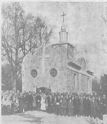
Греко-кат. Церква в Розділлію.

З українського життя в Чехословаччині. В Севлюші обходив своє 60-ліття великий прихильник української молоді, б. секретар сенату Українського Університету у Крем'янці, тепер проф. торговельної