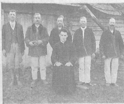
Церковний Комітет зі своїм українським душпастирем у селі Гирова, к. Дуклі.