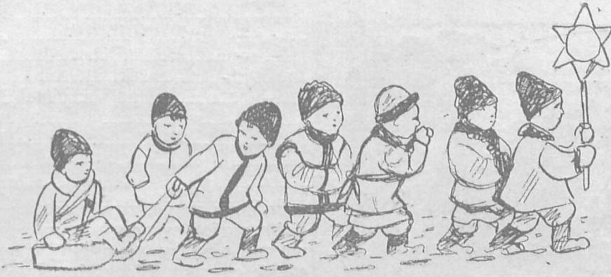
З КОЛЯДОЮ НА РІДНУ ШКОЛУ.

Всім нашим Читачам і Прихильникам у Лемківщині й за Океаном шле Редакція й Адміністрація „Нашого Лемка“ потрійне побажання: саме на порозі четвертого року нашої спільної культурно-світної праці на Лемківщині, з нагоди Нового Року й Христового Різдва. Те, що маємо собі спільно сказати, усім нам добре знає: засіваймо наші любі гори Карпати здоровим зерном національного освідомлення, уводім у наші хати якнайбільше правдивого сонця та першзавсе свято бережм Христа в наших серцях. Христос Раждається!