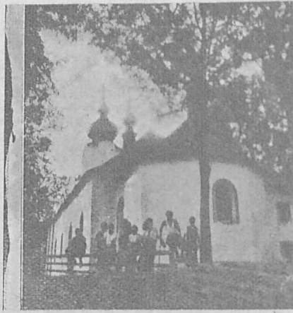
Греко-кат. Церква в Явірках.