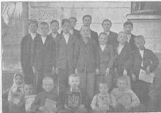
Лемківська молодь — читачі українських дитячих книжечок і часописів, у селі Мшанна, ксло Дуклі, перел греко-католицьким приходством.