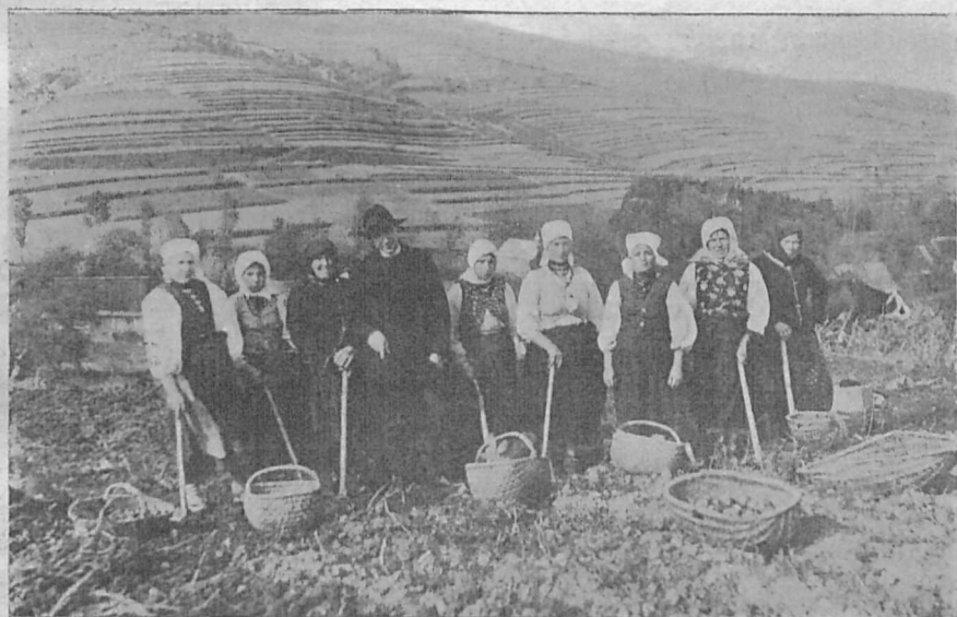
На Лемківщині копають бандурки. На світлині бачимо, як люди в Дуклянщині — село Гирова — допомагають своєму українському священникові викопати бульбу.