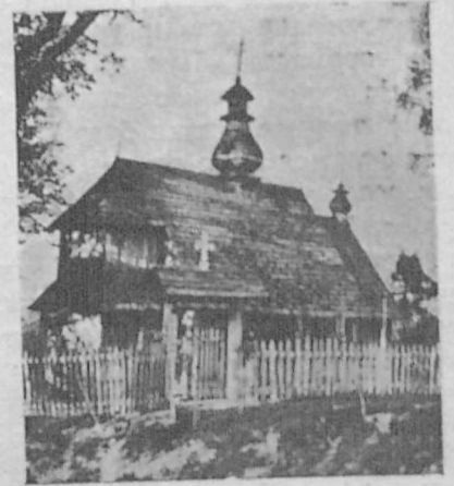
Деревляна Церква Рожд. Пр. Богородиці, зб. 1743 р. в Лодні, біля Мриголода.

Купуйте тільки найкращі шевські кілки ДЕНДРА