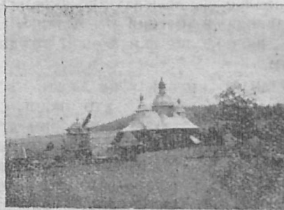
Церква в Кривій зб. 1924 р.

Чи не ліпше записатися одним і другим до читальні, а є в Кривій і