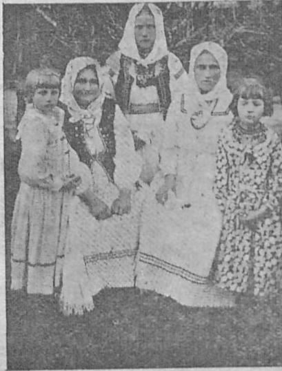
Народні жіночі строї на Лемківщині. Сидять невісти з гарними дівчатками, зо села Полонна к. Буківська.