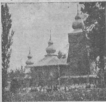
Лемківська церква в Чирній біля Грибова, зб. 1892 р.