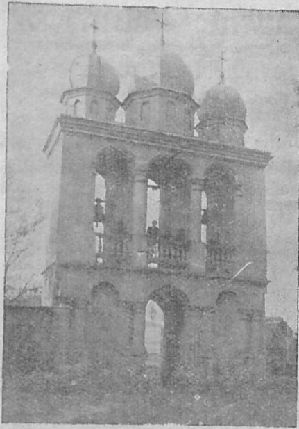
Святоюрівська дзвіниця в Юривцях — Сяніччина.

Багато лемків, будучи підчас війни на різних фронтах та в різних краях, головню в Америці, прозріли та пізнали, куди їх вели русскі проводирі з Сянока. Вони зрозуміли, що те може бути москалів за Сяном, коли їх немає до Сяну, пізнали, які їх батьки та чії вони діти, переконалися, що вже годі довше оставати в темноті, якщо не мають марно пропадати та стати погноєм других — Оснували кооперативи, читальні «Просвіти», Кружки «Рідної Школи», почали масово читати рідні часописи, книжки, давати театральні вистави. Побачили це «русскі», що нема їм уже місця по селах, бо людям відкрилися очі, а вони, їхні довоєнні проводирі остали зайвими, остали пастирями без стада. І давай наново здобувати бодай колишні їхні твердині як: Костарівці, Чертеж, Юривці, Вільхівці, Сянічок, Межибрідь і інші. Найбільше завзялися на Костарівці. Підшукали в селі ще кількох твердолобих та тяжко думаючих недобитків, русских, жадних користей і зачали їх посилати до поліції, то до староства... І посипалися доноси, наклепи, брехні на невинних людей, тяганина та арешти, а вершком всього було розв'язання Кружка «Рідної Школи», неправне загарбання добре просперуючої кооперативи «Надія», яка має навіть свій мурований дім. — Тепер у селі «руський кооператив», до якої мало хто ходить та мало хто купує, рівнож і читальня Качковського пустою світить — бо ніхто не приходить, а в салі відбуваються забави та танці тих, що винаймають собі, гроші йдуть до кишені управн. — Люди від-