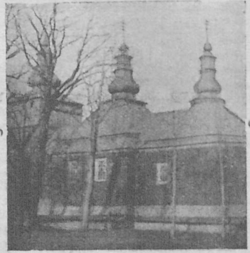
Деревляна церква в селі Перегримка, біля Жмигорода, зб. 1870. р.

Хоч село має славу минувшину, однак тепер (на жаль!) має сумну дійсність. Ще в 1926 році один господар, по повороті з Америки заволок тут сектанство, яке страшно розідає село. І хоч теперішній парох про-