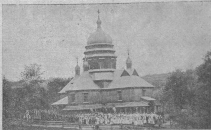
Дерев'яна Церква в селі Кам'яна коло Римадова, збудована в 1925 р.; з празником в травні в дні Перен. Моці св. О. Миколая — (на теплому Школу).