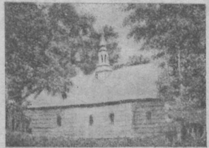
Дерев'яна старинна церква в Іздебах, коло Березова, збудована в 17 ст.