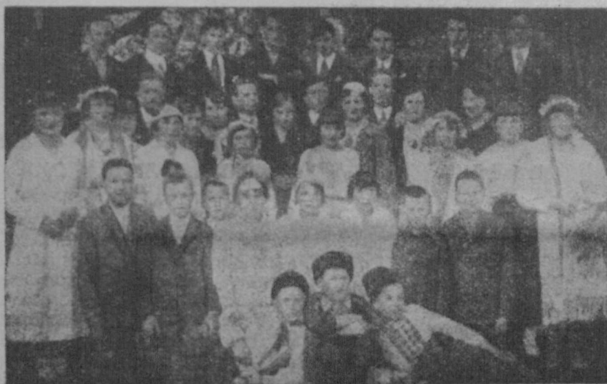
Дуже працюючі та ідейні члени Кружка „Рідної Школи“ в Костарівцях — коло Сянока.

ЦІНА ЧИСЛА 15 ГР. ПЕРЕДПЛАТА В КРАЮ: Річно 3 зол., Піврічно 1'80 зол., Чвертьрічно 1'— зол. ЗАКОРДОНОМ: Річно 1½ ам дол. або рівновартість.