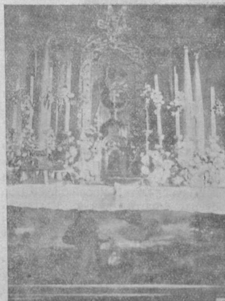
Чудотворна ікона Покр. Пресвятої Богоматері в церкві села Гирова з б. 1870, відновленій 1927.