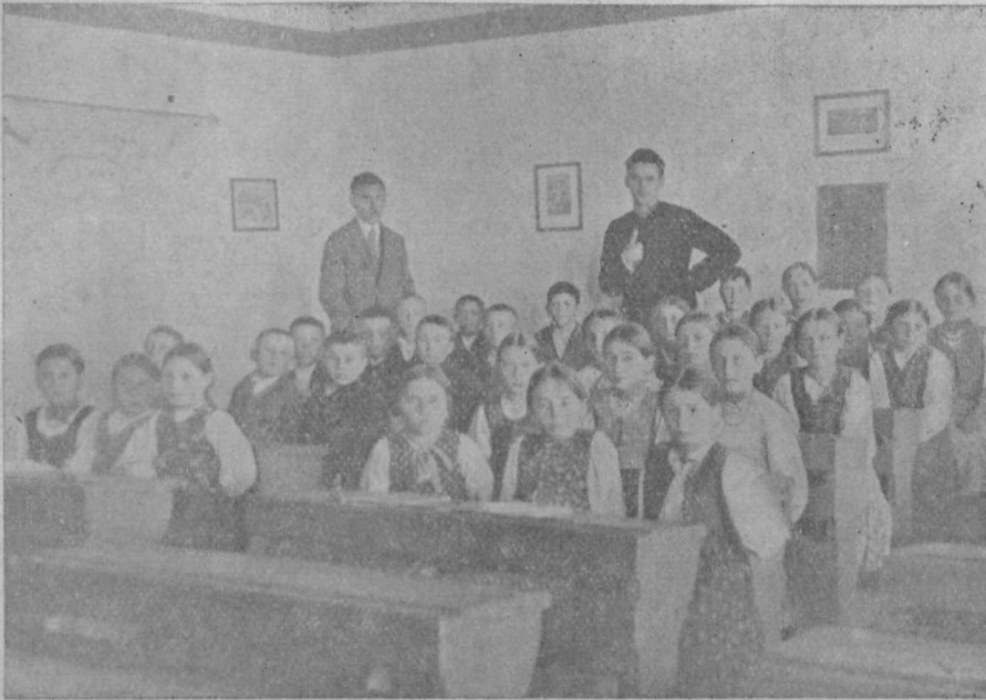
Лемківська шкільна дітвора в селі Гирова коло Дуклі.