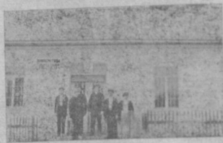
Кооператива в Святковій вел. має власну домівку.