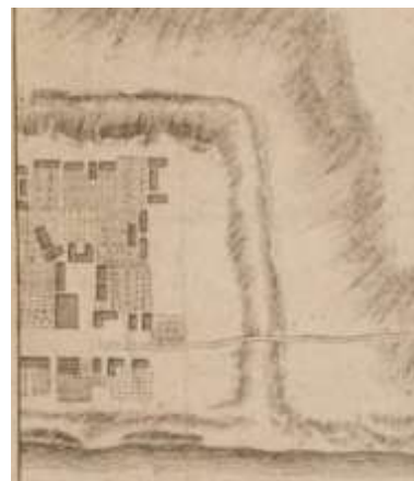
Рис. 2. План Манштайна станом на 1739 р. (FBC, 1771)