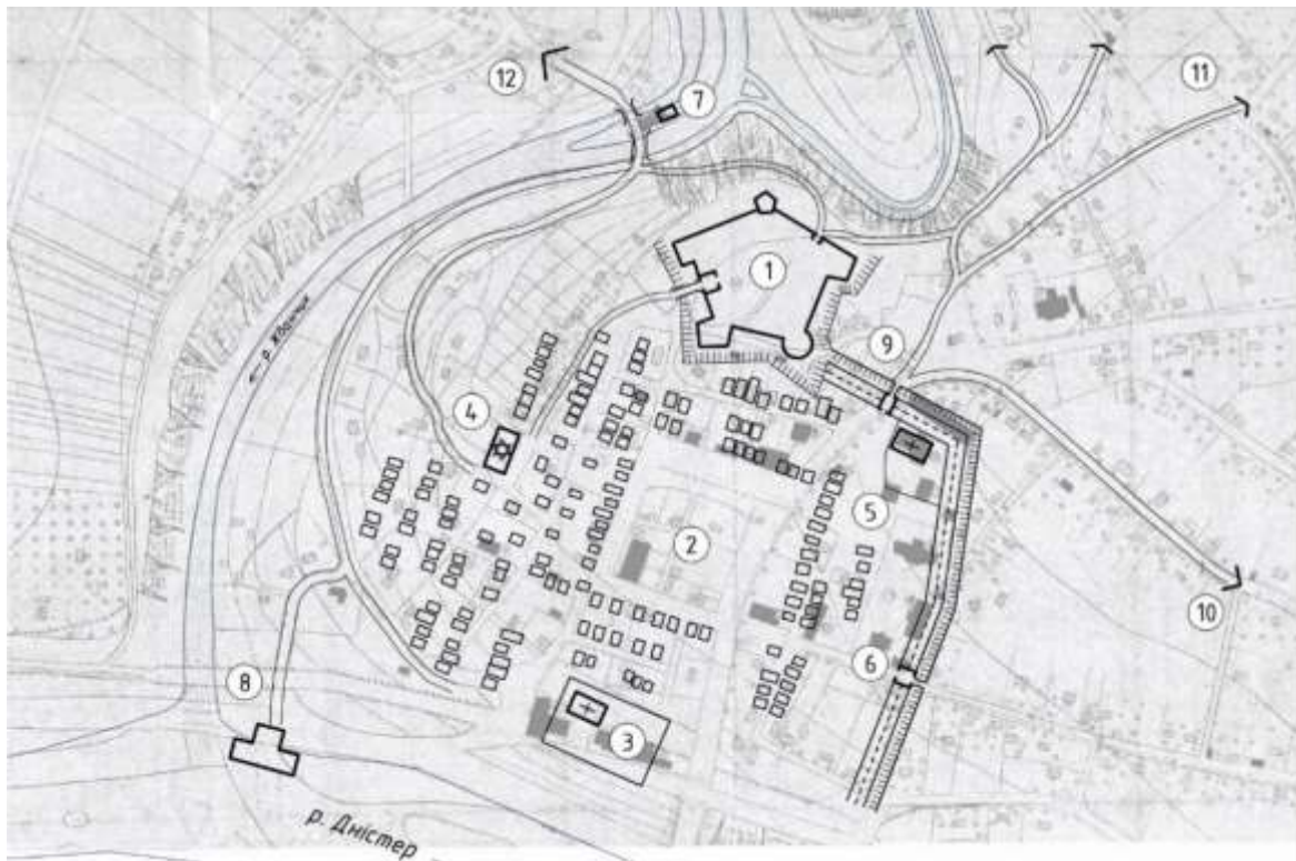
Рис. 8. Гіпотетична реконструкція укріплень Жванця у XVII-XVIII ст. :

взаємопов'язані і однозначно є одночасовими. Вони склалися з сухого рову, валу, можливо, з частоколом та двох брам. Обрис оборонного периметру був майже квадратним в плані, північний відрізок його був прямий, а східний мав невеликий залом у бік поля, спричинений, можливо, особливостями рельєфу (примикаючи до цього відрізка балки ззовні від міста). Зі сторони каньйону та замку місто додатково не захищалося. Відомості про вежі, башти чи бастионні міські укріплення відсутні. По центру міста розташовувалась ринкова площа. За конфігурацією вона була правильної прямокутної форми, наближеної за пропорціями своїх сторін до квадрату, до якого з південної сторони примикали торгові заїжджі квартали. По периметру ринку розміщувались кам'яниці й торгові лавки. Загальні розміри ринкової площі склали 1,765 га. Його територія у XIX ст. забудована торговими ятками, а пізніше з'явився повноцінний квартал, який існує по сьогодні. В результаті цього від незабудованої території давньої площі залишився невеликий фрагмент її північної частини. Недалеко від ринкової площі розташовувався костел, який був оточений кам'яними мурованими стінами і ймовірно виконував оборонно-караульну функцію. З 1740 р. на його місці збудовано мурований костел Непорочного Зачаття Діви Марії, який закінчений та освячений у 1791 році із втратою своїх оборонних функцій.