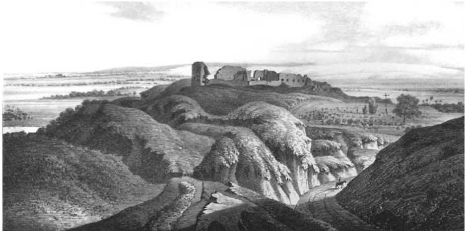
Іл. 2. Старостинський замок. Мацей-Богуш Стенчинський, 1847 р.