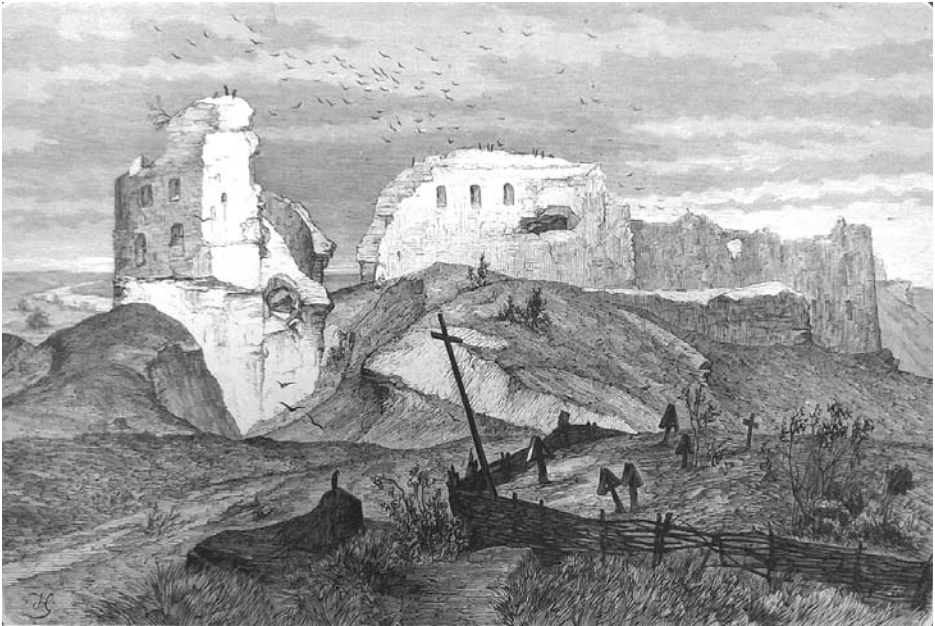
Іл. 5. Руїни замку в Галичі над Дністом. Генрих Грабінський, друга половина XIX ст.