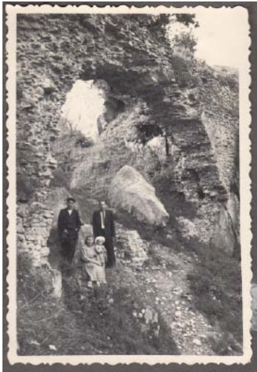
Рис. 5. Мешканці с. Урич на тлі залишків стіни на Камені з південного боку.

Низка дослідників XIX ст. вказували на наявність у Тустані цегляної стіни чи її фрагментів, маючи на увазі, перш за все, згадану вище велику стіну з південного боку дитинця. Цю тезу спростував свого часу М. Рожко, адже під час досліджень не було виявлено жодних слідів цегли у кладці кам'яної стіни 24 . Також слід зазначити, що під час археологічних досліджень Тустані було виявлено лише дев'ять фрагментів цегли 25 . Більшість з них невеликих