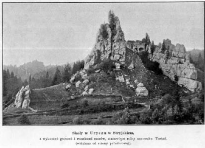
Рис. 4. Видля Каменю з південного боку. Pic. 4. Southern view of Kamin (Rock).

що утримував склепіння двох арок. Це зафіксовано на фотографіях Павла Раппопорта 18 , Петра Лінинського 19 та мешканців с. Урич (рис. 5) 20 . За інформацією від Григорія Яроша, стіна завалилась у березні 1970 р. 21