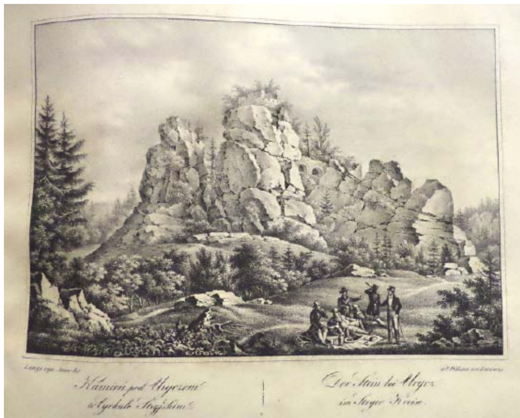
Рис. 2. Антоній Ланге. Літографія "Kamień pod Uryczem w Cyrkule Stryjskim / Der Stein bey Urycz im Stryer Kreise". 23,4 × 16,3 см. Pic. 2 Antoni Lange. Lithograph "Rock near Urych in Stryi District". 23.4×16.3 cm.