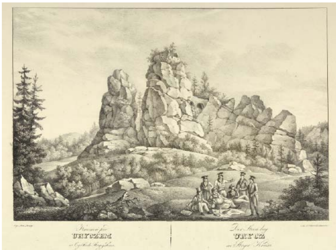
Рис. 1. Антоній Ланге. Літографія "Камієнь под Урычем в Сыркеле Стрыжским / Der Stein bey Urych im Stryer Kreise". 56×43,5 см.