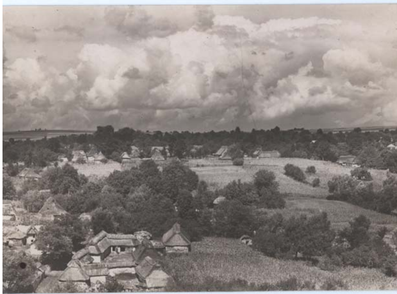
Замок (ліворуч) та греко-католицька церква Пресвятої Діви Марії праворуч від будівлі кооперативу «Згода». Світлина 1933 р. з приватного архіву О. Кагляна (Київ)

но-східних рубежів Речі Посполитої в останніх десятиліттях XVII століття 17 .