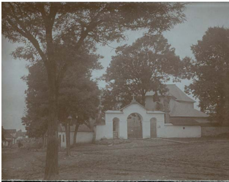
Чернелиця. Вигляд римо-католицького костелу св. Антонія Падуанського з центральної площі. Світлина 1921 р. Зберігається у відділі рукописів Національної наукової бібліотеки України імені Василя Стефаника (Львів)