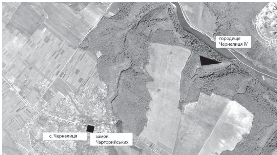
Городище Чернелиця ІV. Ситуаційна схема