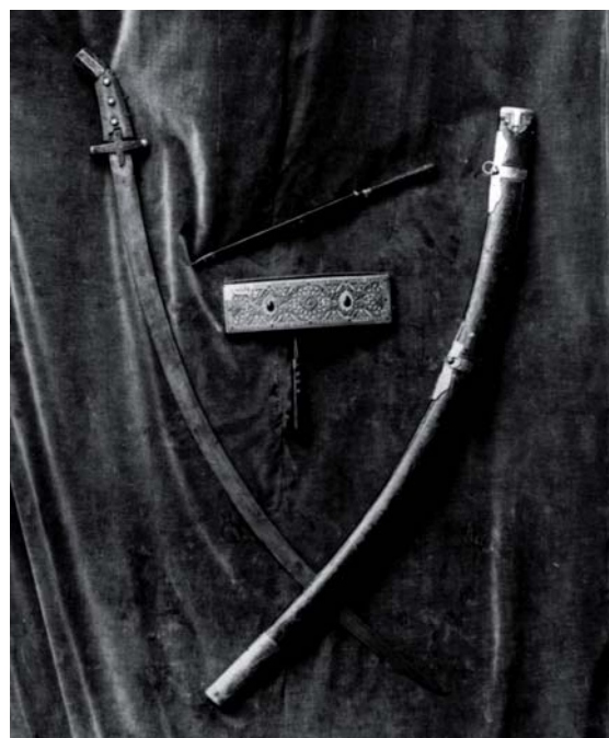
Озброєння полковника Мавриція Ценського, яке на початку XIX ст. зберігалось у Чернелиці.