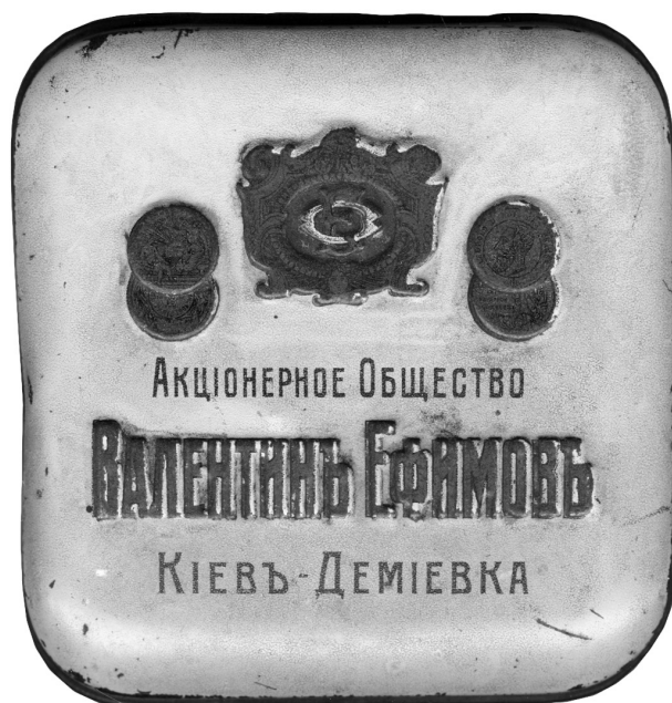
Рис.3. Зразок пакувального матеріалу фірми «Метал. изд. А. Жако и Ко, Одесса».

Одночасно з будівництвом фабрики вакси у 1880 р. було організовано виробництво пакувальних виробів для її продукції: жерстяних коробок, декорованих друкованими зображеннями та узорами. У 1881 р. було налагоджене залізо-лудильне виробництво та випуск білої жерсті [19].