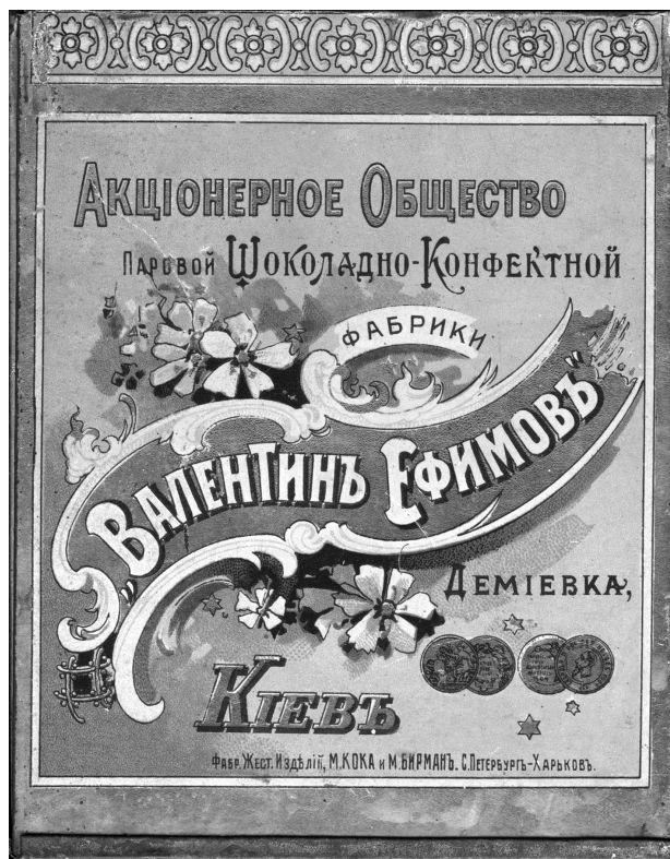
Рис. 5. Зразок пакувального матеріалу фірми «М. Кока і М. Бірман».

Сувенірна коробка фірми «М. Кока і М. Бірман» з зібрання НМІУ за формою та оздобленням подібна до одеської. На кришці коробки розміщена фоторепродукція зображення Володимирського собору у Києві, на двох бічних гранях – будинку міської Думи та пам'ятник Б. Хмельницькому. На торцях коробки золотистим, темно-синім і білим кольорами зазначено назву кондитерської фірми: «Акционерное общество / паровой Шоколадно-Конфектной / фабрики / «Валентин Ефимов» / Демієвка / Київ» (рис. 5). Напис «Валентинъ Ефимовъ» виконано на квітковому тлі на золотистій стрічці, обрамленій білими завитками. Унизу дрібним шрифтом розміщено напис: «Фабр. Жест. Издѣлій, М. Кока и М. Бирманъ. С.-Петербургъ-Харьковъ». Під словом «Демієвка» розміщені зображення медалей виставок 1904 р. у Парижі та Брюсселі.