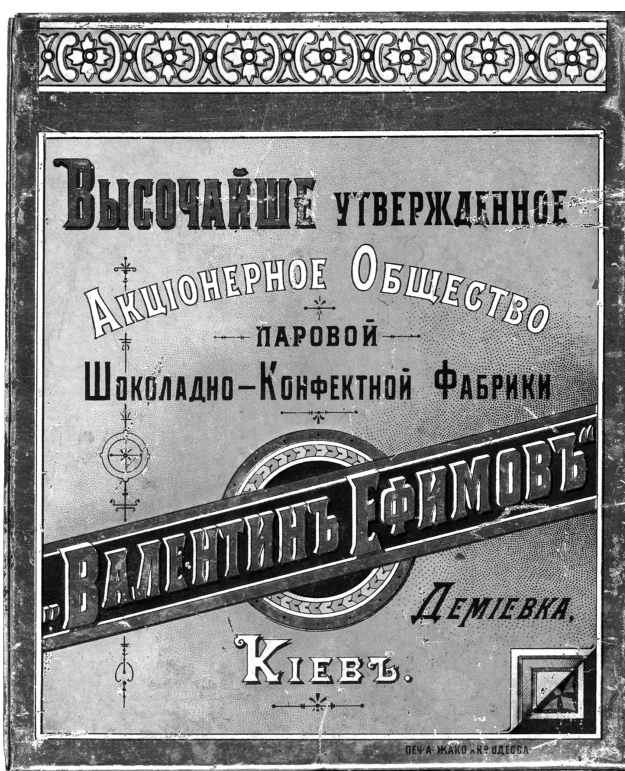
Рис. 4. Зразок пакувального матеріалу фірми «Метал. изд. А. Жако и Ко, Одесса».

Інша сувенірна коробка із з'ймною кришкою призначена для цукерок або печива. Вона має форму паралелепіпеда, грані якого прикрашені фоторепродукціями з видами Києва, виконаними у блакитно-зеленій кольоровій палітрі. На кришці зображено Олександрівський узвіз. На двох бічних гранях представлені зображення будівлі Університету св. Володимира та вулиці Хрещатик. Кожна репродукція облямована золотистою рамкою, на якій розміщено назву малюнка. На торцях коробки золотистими, чорними та білими літерами у кілька рядків зазначено назву виробника солодощів (рис. 4): «Височайше утвержденное / Акционерное Общество / паровой / Шоколадно-Конфектной Фабрики / «Валентинъ Ефимовъ» / Деміевка / Киевъ». Напис «Валентин Ефимовъ» розміщений на чорній діагональній смужі, яка перетинає медальйон чорно-золотистого кольору із блакитним орнаментальним краєм. Унизу праворуч на золотій рамці дрібним шрифтом зазначена назва виробника коробки: «ПЕЧ. А. ЖАКО и К о Одесса». По верхньому краю коробки і бічним граням кришки нанесено орнаментальний пояс стилізованого рослинного орнаменту, візерунок якого складається із чотирипелюсткової квітки, обрамленої завитками.