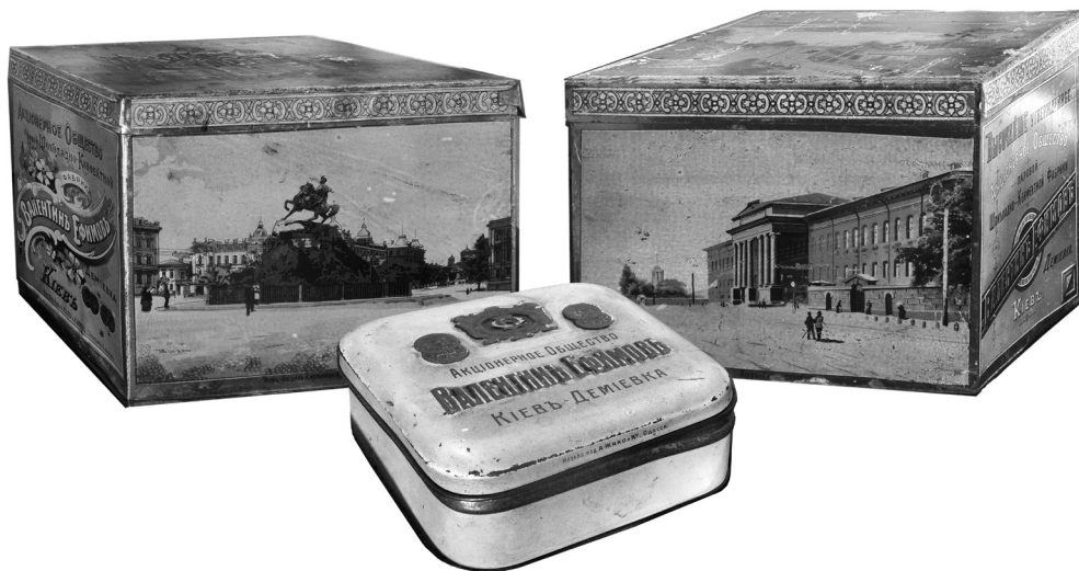
Рис. 2. Зразки пакувальних матеріалів фірми «Жако і Ко» і «М. Кока і М. Бірман».

В фондах НМІУ також зберігаються три зразки пакувальних матеріалів для продукції фабрики В. Єфімова – металеві коробки для цукерок та печива, виготовлені на заводах жерстяних виробів фірми «Жако і К°» в Одесі та «М. Кока і М. Бірман» в Санкт-Петербурзі (рис. 2).