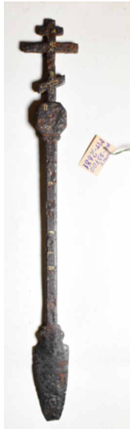
Рис. 1. 2, 3