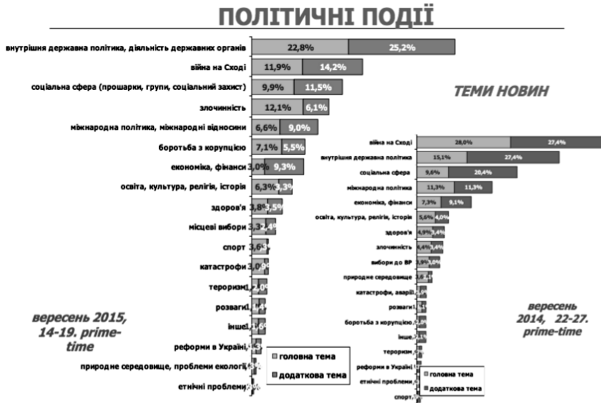
Рис. 5.2. Контент-аналіз телефіру [122].

Головний висновок, який напрашується і був зроблений експертами АУП, що в українських теленовинах дисбаланс на користь влади зберігається: увага до представників правлячої коаліції у чотири рази більша за увагу до опозиції. Зрозуміло, що це частина стратегії використання ресурсів правлячої партії, що пов'язана з місцевою виборчою кампанією. Однак важливим залишається факт розуміння того, що інформація має бути збалансованою. Це корелюється з лозунгами, під якими нинішня правляча партія приходила до влади. На жаль, замість того, щоб розвивати технології збору, обробки та подання інформації, про які вже йшлося, представники влади пішли найбільш простим шляхом, який до них вибудовувала попередня влада, а саме – використання медіаманіпулятивних засобів та методів для формування порядку денного з метою впливу на політичну свідомість громадян.