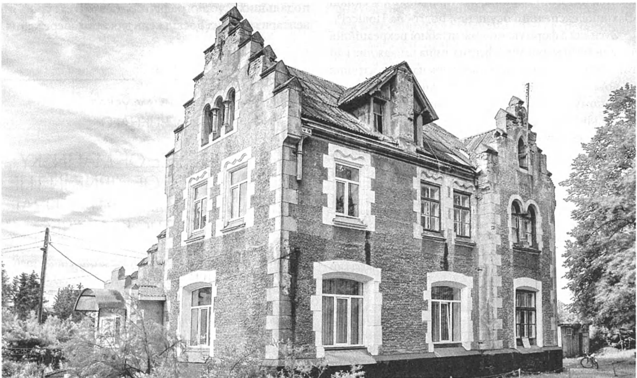
Рис. 5. Електростанція. Сучасний стан. 2017 р.

Архітектура двоповерхової будівлі електростанції також контрастує з усіма іншими об'єктами і нагадує міський англійський особняк, завершений простим двосхилим дахом з характерними ступінчастими щипцями (Рис. 5). Верхню частину фасаду акцентують вікна, розділені мініатюрними колонками з романськими капітелями. Поєднання гладких кам'яних поверхонь кутового русту з фактурною поверхнею сірої цементної штукатурки є додатковим прийомом, що посилює монументальність цієї невеликої будівлі. На першому поверсі первісно був змонтований котел, парова турбіна, генератор струму. Другий поверх призначався для проживання сім'ї електрика.