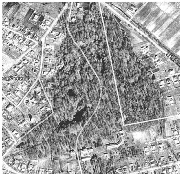
Рис. 1. Резиденція Малинських в с.Зірне на Рівненщині. Просторово-планувальна структура. Сучасний стан. ( www.google.com/maps/place/Зорное , 10.10.2018 р.)

Особливості архітектурно-стилістичного образу резиденції. На відміну від пишності та репрезентативного характеру барокових чи класицистичних резиденцій, які будувались на Волині у XVIII — на