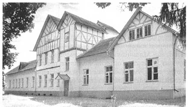
Рис. 3. Господарська будівля. Сучасний стан. 2017 р.

Аналогічні стилістичні прийоми були використані для архітектурного вирішення господарської будівлі (Рис. 3). Протяжний одноповерховий корпус складної, Н-подібної в плані конфігурації має двоповерхову центральну частину з мансардою, дахові щипці якої виконані з використанням фахверкової конструкції, підкресленої нині темно-коричневим кольором пофарбування.