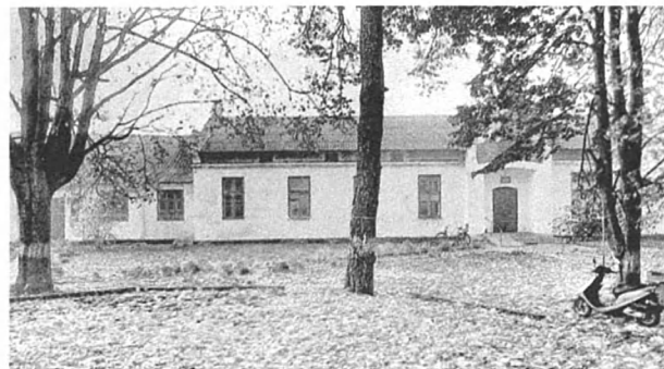
Рис. 6. Конюшня. Сучасний стан. 2018 р. Fig. 6. Stable. Current state. 2018.

Зусилля з формування масштабної рекреаційної зони не були марними. Ефектна зміна пейзажних картин відчувалась під час прогулянок парком, катання на човнах та відвідування альтанки на невеликому штучному острові, сформованому в центрі одного зі ставків 7 . На території було висаджено понад сто видів деревних насаджень, частина з яких були екзотичними для Волині: Веймутова сосна, модрини, кедрі 8 , а також дуби, ялини, канадські клени, ясени.