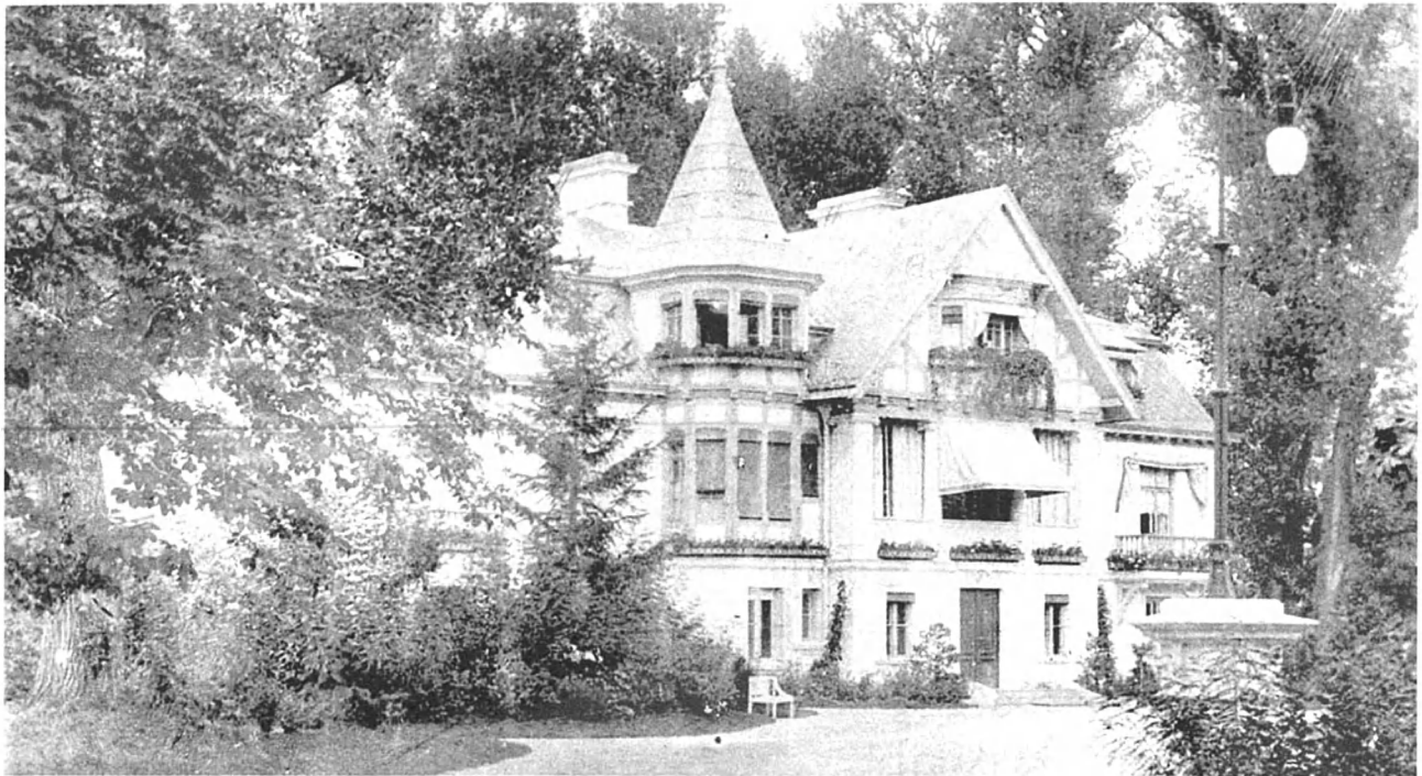
Рис. 2. Палац у Зірному. Фото початку XX ст. Fig. 2. Palace in Zirne. Foto of the early 1900s.

поч. XIX ст., пізніше споруджені садиби мали значно менші масштаби, а функціонально були зорієнтовані на поєднання житлової та господарсько-виробничої функцій.