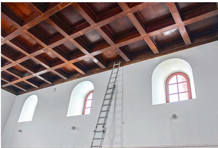
Рис. 3. Фрагмент інтер'єру Тронної зали до початку ремонтних робіт. 2019 р.