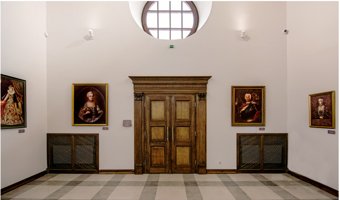
Рис. 4. Інтер'єр Тронної зали після завершенням ремонтних робіт. 2020 р.