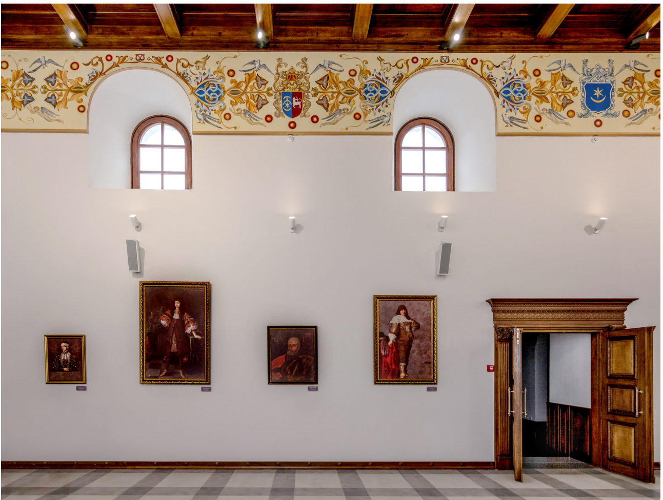
Рис. 5. Інтер'єр Тронної зали після завершенням ремонтних робіт. 2020 р.