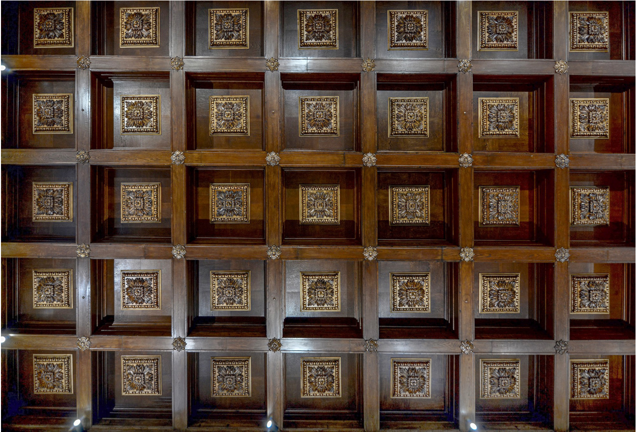
Рис. 6. Фрагмент стелі Тронної зали. Фото В. Луца. 2020 р.

в замкових комплексах Речі Посполитої. Зокрема, прототипами послужили: інтер'єри парадних кімнат Королівського замку на Вавелі (Краків, Польща) середини XVI ст. 2 , зали замку в Шидловці (перша третина XVI ст.), зали-їдальні замку в Шамотулах (Польща), реконструйованого в ренесансному стилі на початку XVI ст., які за хронологією та змістовим наповненням є близькими до створюваного інтер'єру Тронної зали.