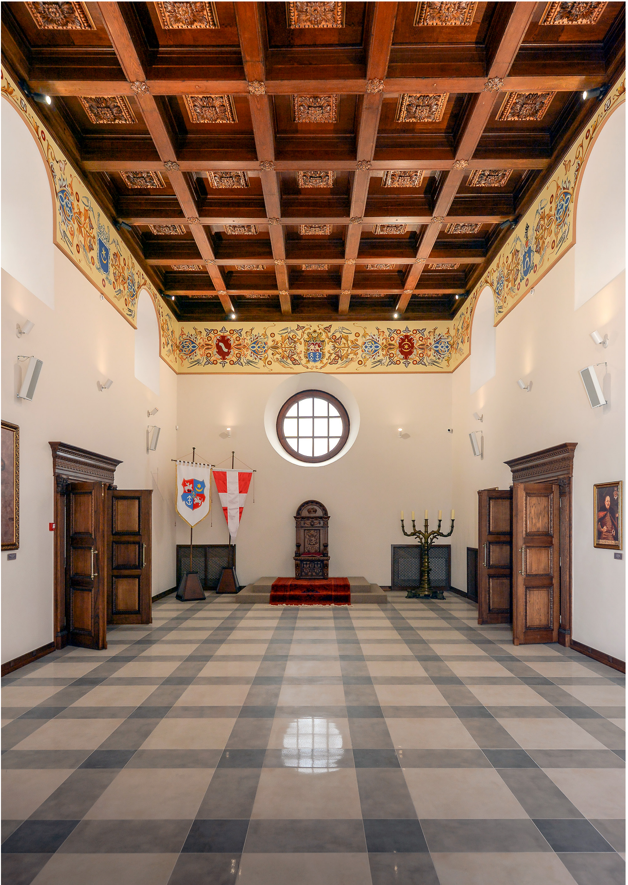
Рис. 3. Інтер'єр Тронної зали після завершення ремонтних робіт. 2020 р.