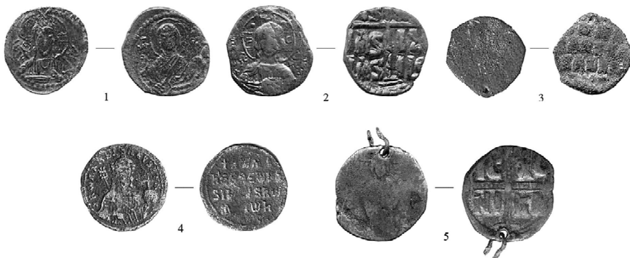
Рис. 2. Византийские фоллисы X–XI вв., найденные на территории Волынской области Украины и зафиксированные Любомльским краеведческим музеем, лицевая и обратная сторона: 1 — анонимный фоллис, класс «G» (1065–1070), медь. Византийская империя. Константинополь. Диамет. — 28,4–25,8 мм, вес — 5 г. Волынь, ЛКМ, временное хранение; 2 — анонимный фоллис, класс «B» (1030/35–1042), медь. Византийская империя. Константинополь. Диамет. — 28,4–25,2 мм, вес — 8,32 г. Волынь, 2000 г., ЛКМ, временное хранение; 3 — анонимный фоллис с отверстием для подвешивания, класс «A» (?), X в., медь. Византийская империя. Константинополь. Диамет. — 25,2 мм, вес — 5,98 г. с. Крупа, Луцкий район, Волынская область. ЛКМ Н-4698; 4 — фоллис императора Романа I (920–944), медь. Византийская империя. Константинополь. Диамет. — 27,2 мм, вес — 5,48 г. Городище в урочище «Колесо», пгт. Головно, Любомльский район, Волынская область, 2014 г. ЛКМ КВ-15254; 5 — анонимный фоллис с отверстием и ушком для подвешивания, класс «C» (1042–1050), медь. Византийская империя. Диамет. — 29,6 мм, вес с ушком — 9,04 г, без ушка — 8,83 г. Урочище Сад, пгт. Шацк, Шацкий район, Волынская область, конец 2000-х гг., частная коллекция.