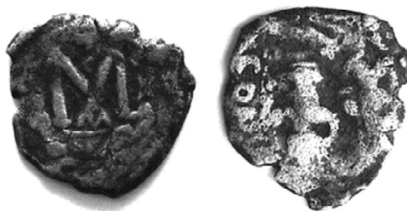
Рис. 1. Фоллис, предположительно чеканенный при императоре Константе II (641–668). Медь, Византия. Размер 25,3 Ч 23 мм, вес – 5,73 г. с. Воютин, Луцкий район, Волынская область, 2015 г. ЛКМ, временное хранение.