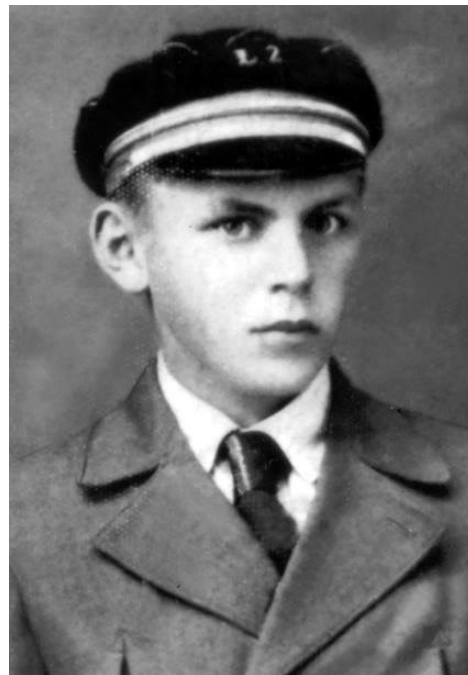
Нещодавно віднайдене фото Мирослава Кіндзірського (ліворуч) та більш відоме його фото.

Кіндзірський Мирослав Васильович народився 17 вересня 1919 року в селі Чорний Потік Заставнівського району Чернівецької області. Закінчив Чернівецький університет. Із 1937 року член ОУН (псевдо: “Боевір”, “Степан”). У 1941 році – організаційний референт Буковинського обласного проводу ОУН. У січні 1942 р. заарештований румунською Сигуранцою (з-під варти утік). Скерований на Східноукраїнські землі: з кінця 1942 року по березень 1944 року Кіндзірський – референт пропаганди Одеського обласного проводу ОУН. У серпні 1944 року переведений на Буковину. У вересні-грудні 1944 року – організаційний референт Буковинського обласного проводу ОУН, виконував обов’язки провідника Буковинського обласного проводу ОУН. Загинув 29 грудня 1944 року під час бою з військами НКВД у с. Васловівці Садгірського (згодом Заставнівського) району Чернівецької області. Похований у с. Чорний Потік Заставнівського району Чернівецької області.