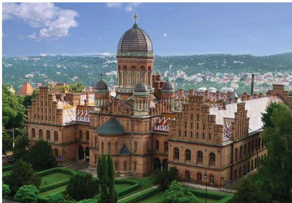
Архітектурний ансамбль Резиденції митрополитів Буковини і Далмації, Чернівці.

У переліку ЮНЕСКО, який зараз налічує трохи більше 1000 пунктів, тільки 6 університетів, причому більшість з них була включена до цього списку після 2000 р. Зокрема, це Monticello and the University of Virginia in Charlottesville (США, дата включення до переліку ЮНЕСКО 1987 р.), University and Historic Precinct of Alcalá de Henares (Іспанія, 1998 р.), Ciudad Universitaria de Caracas (Венесуела, 2000 р.), Central University City Campus of the Universidad Nacional Autónoma de México (Мексика, 2007 р.), Чернівецький національний університет ім. Ю. Федьковича (Україна, 2011 р.), University of Coimbra – Alta and Sofia (Португалія,