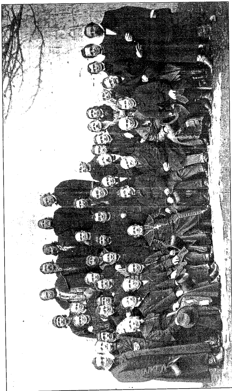
Українські послы I каденції (1861–1866) Галицького сейму