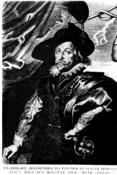
Рис. 2. Король Владислав IV