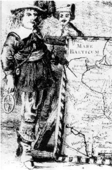
Рис. 1. Ян Пляйтнер та Ілля Арцишевський