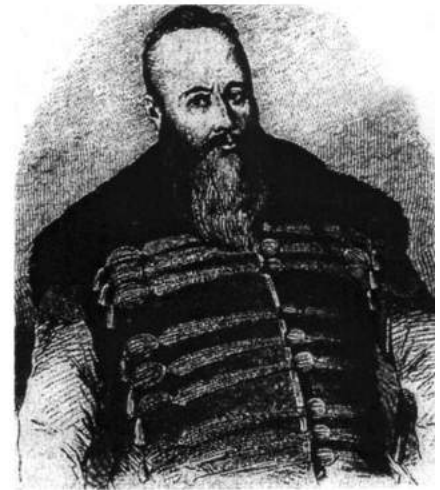
Рис. 3. Станіслав Конєцпольський